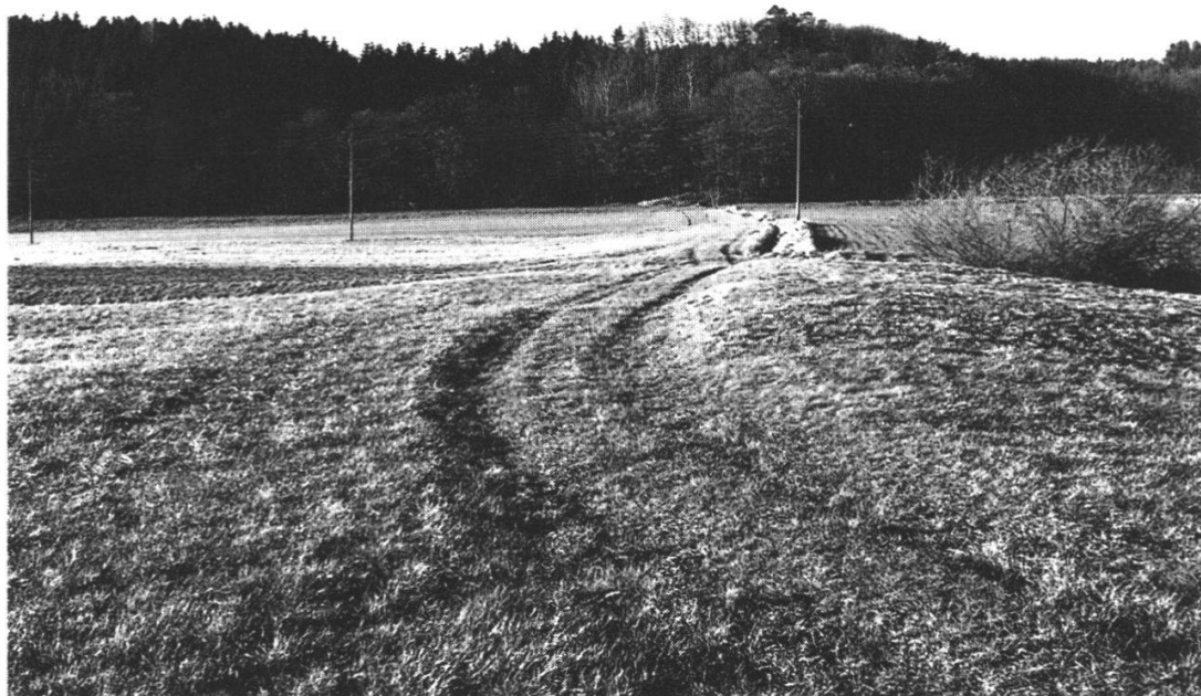
Abb. 14: Der östliche oder grosse Däntsch des Grossweiers heute, nachdem er für die landwirtschaftliche Nutzung stark eingeebnet worden ist (siehe Verlauf des Feldweges). Im Mittelgrund der tief eingesenkte Kanal , im Hintergrund der Kestenholzer Weierrain .

Der Hauptabfluss erfolgte nun während 250 Jahren am südlichen Ende des grossen Däntsches in der südöstlichen Grossweier-Bucht