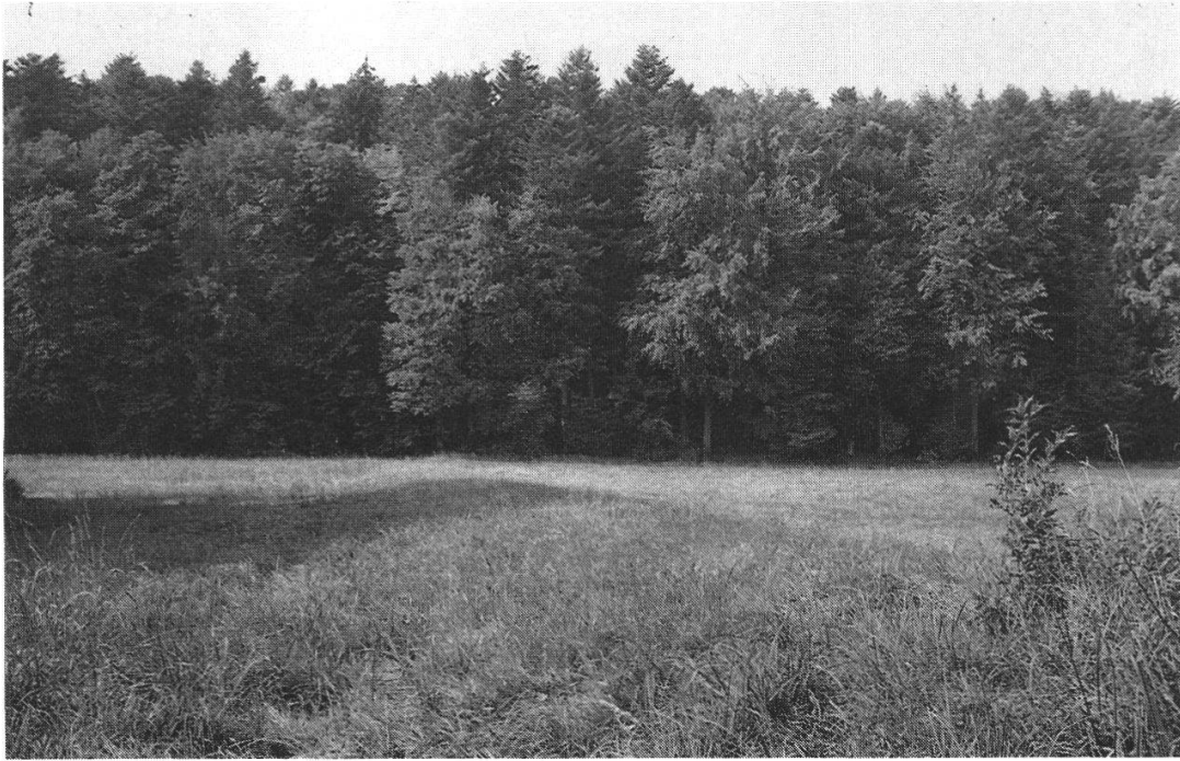
Abb. 9: Der Rest des Däntsches am Südwestufer des bernischen Kleinen Weiers , welcher sich bis zum bewaldeten Kestenholzer Weierrain erstreckte.