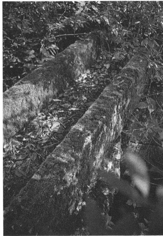
Abb. 10: Zwei Zeugen vergangener Zeiten: Links: Das kaum noch beachtete Überbleibsel des einst ebenfalls beachtlichen Kleinen Weiers auf Berner Gebiet wird heute von den Anstössern « Plumpe » genannt und steht unter bernischem Naturschutz. Rechts: Über dem Abfluss, dem jungen Moosbach , verbirgt sich im Gestrüpp noch heute ein Schieberbrücklein. Darüber führt ein steinerner Wässerkännel von 1886.