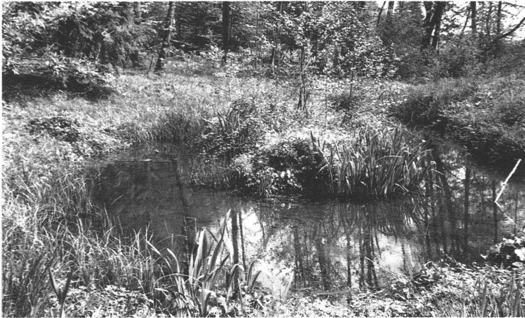
Abb. 11: Das Kestenholzer Naturschutzreservat heute: der letzte Rest des Grossweiers ...

Quellgebiet des Fulenbaches barg der Grosse Weier zumindest während seiner grössten Ausdehnung alle ihn speisenden Quellen auf seinem Grund, nämlich die erwähnten Grundwasseraufstösse. Drei grössere davon lagen auf solothurnischem Gebiet (s. Abb.3). Ein weiterer Aufstoss befand sich im bernischen Teil des Weihers südlich der Kantonsgrenze. 84 Sie alle erhielten wahrscheinlich ihr « Kaltwasser » von einem unterirdischen Abfluss aus dem westlichen Teil des rund 20 bis 25 Meter höher gelegenen Gäuer Grundwasserstromes. 85 Diesen Grundwasser-Abfluss muss man sich als Überlauf über eine unter den Schottern liegende Molassekante vorstellen. Vorausgesetzt diese Vermutung werde einst bestätigt, floss das Grundwasser – und es fliesst in verminderter Menge noch heute – wahrscheinlich durch die Hochterrassenschotter des Mittelgäuer Höhenrückens hindurch und speist seit 1905 auch die Trinkwasserversorgung der Gemeinde Kestenholz (s. Abb. 12). Eine diesbezüg-