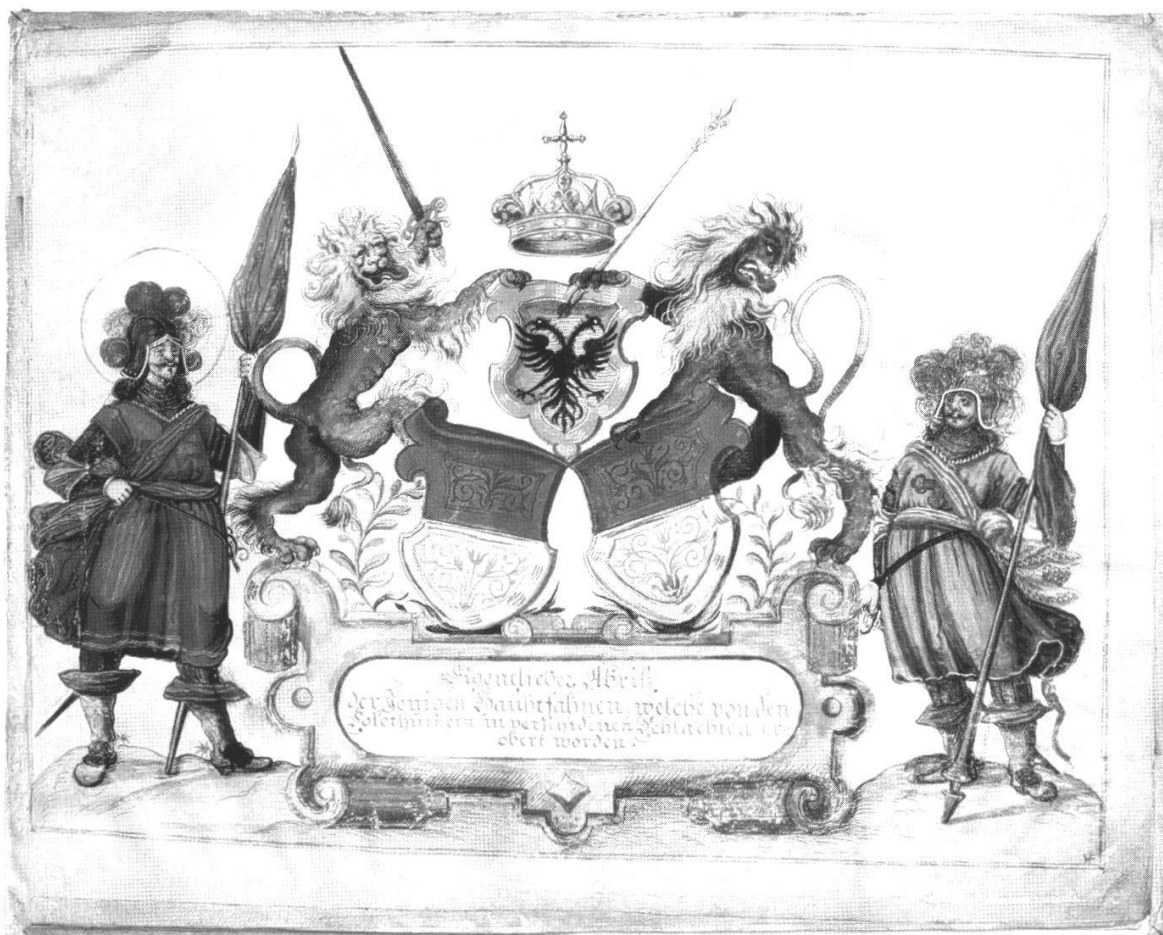
Abb. 1: Das Fahnenbuch von 1641, Titelblatt.

Aktenkundig sind aber seine verschiedenen handwerklichen und künstlerischen Arbeiten, die im Folgenden vorgestellt werden sollen.