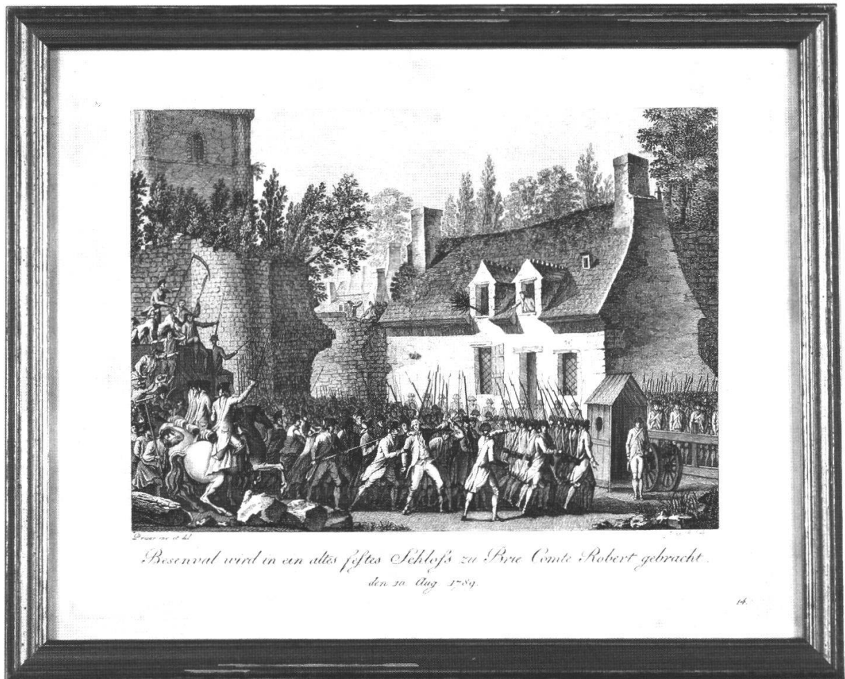
Abb. 4: Die Verhaftung des Barons am 10. August 1789. Stich von Prieur und J.An. Otto. 14. Blatt aus dem «Denkbuch der franzoesischen Revolution vom ersten Auf- ruhr in der Vorstadt S.Antoine den 28.April 1789 bis zum Todestag Ludwigs XVI. den 21.Jänner 1793 in 42 Kupfern». Band 1, Memmingen 1815. Museum Schloss Waldegg.

erprobten, altgedienten General bass erstaunen kann, breitete er auf dem Wirtshaustisch seine Landkarte aus und fragte Gäste und Wirt, wo hier eine Strasse Richtung Schweiz durch führe, die keine grössere Stadt durchquere. 39 Der Wirt roch den Pfeffer, nahm an, sein Gast sei ein flüchtiger Aristokrat, und suchte im Dorf einige bewaffnete Männer zusammen. Sie nahmen ihn fest und liessen ihn nach Paris bringen, wo er in Untersuchungshaft gesetzt wurde.