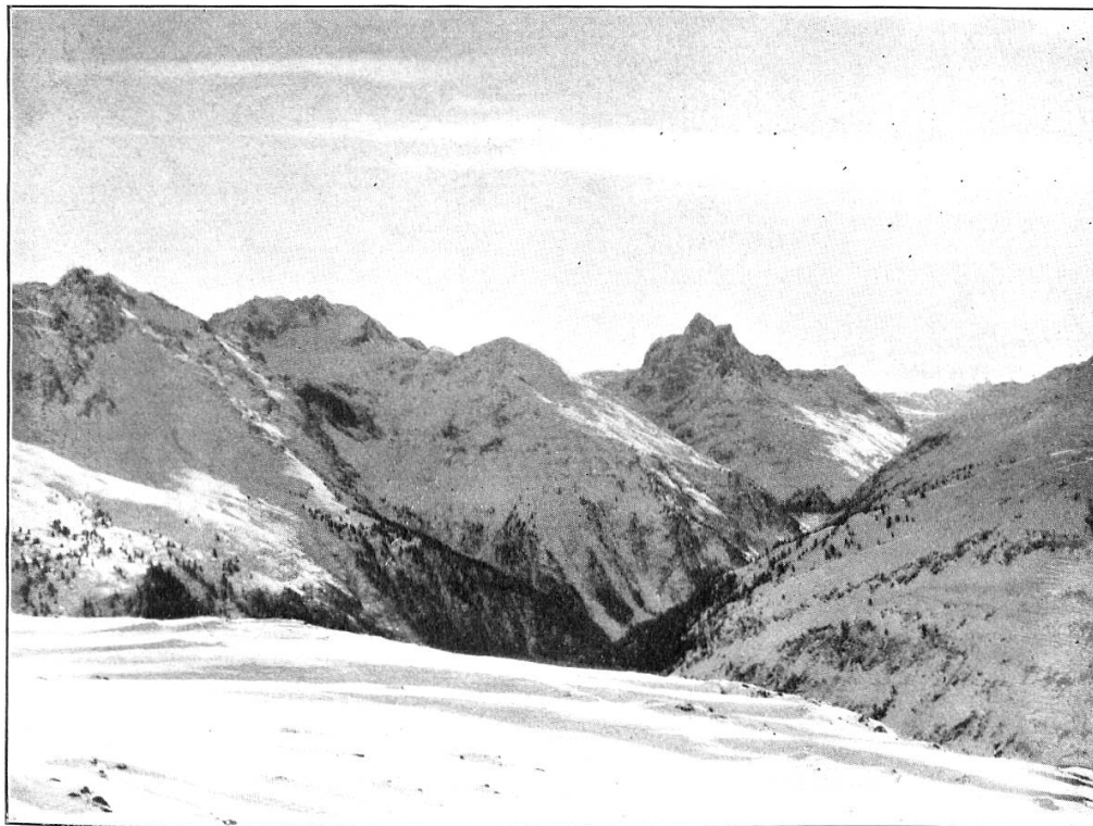
Einblick ins Fervall vom Galzig.