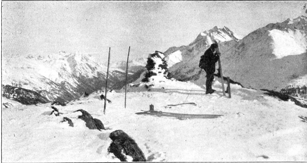
Blick vom Galzig auf den Riffler.