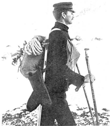
Der Verfasser in voller Ausrüstung

Die Skiausrüstung besteht aus: Ski von der Körperlänge des Läufers oder nicht viel darüber. Dieser kurze Ski ist für den militärischen Dienst dem langen unbedingt vorzuziehen; denn der Dienst unsrer Skitruppen führt nicht über offenes Skigelände, sondern im Gegenteil über sehr bedecktes, durch Wälder, Schluchten. In solchem Gelände ist aber der kurze Ski für Aufstieg und Abfahrt weit beweglicher, und beim Nichtgebrauche handlicher und leichter zu tragen. Rückgleitschutz aus Seehundsfellen, welche leicht auf- und abnehmbar sind