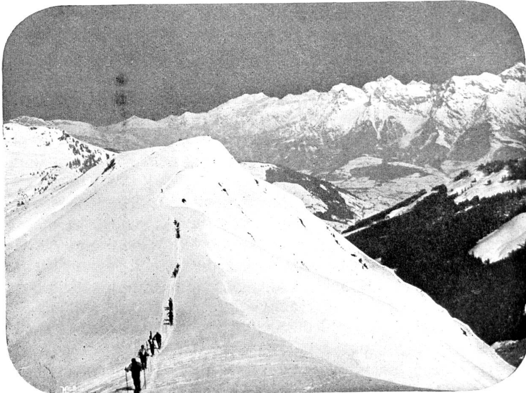
Ski-Abteilung im Marsch am Hundstein

auch die erstere gewiss ihre Berechtigung hat, so ist doch zu bedenken, dass bei einem Gebirgskriege, besonders im Winter, die Verwendung der Skitruppen eine umfassendere sein dürfte, als nur für den Melde- und Verbindungsdienst. Es ist wohl richtig, dass sie für alle oben erwähnten Dienste in Betracht kommen werden, hauptsächlich aber werden immer mehr Skitruppen selbständig, nicht im engsten Verbandsverbande, bei Operationen in unseren Bergen in Tätigkeit treten.