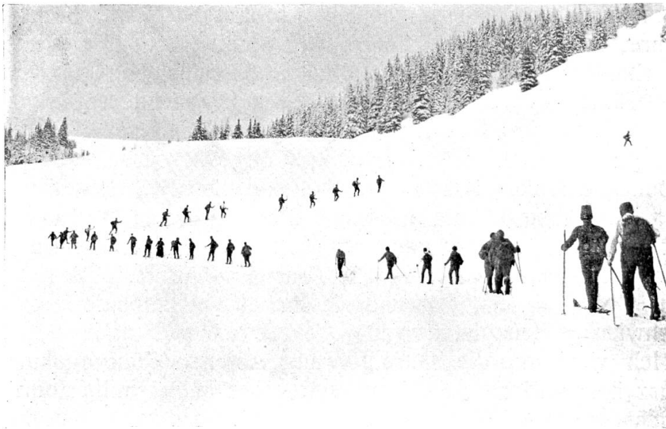
Ski-Abteilung im Marsch

Als Uebungsgelände diene ein Gletschergebiet, in dem die ganze Hochtouristik, speziell die winterliche, an Hand praktischer Beispiele erlernt werden kann. Selbstverständlich ist ein sehr abwechslungsreiches Gebiet vorzuziehen. Der längeren Tage und der Witterung wegen halte man diese Kurse in den Monaten März oder April ab; sie bieten nicht