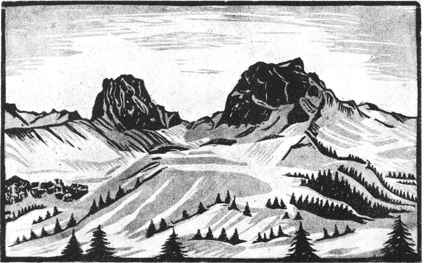
Nüenen mit Gantrist

Nach Original-Holzchnitt von Fr. Schuler, Wattenwil