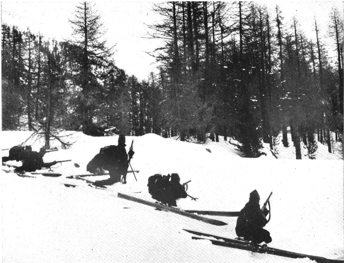
Patrouille im Gefecht