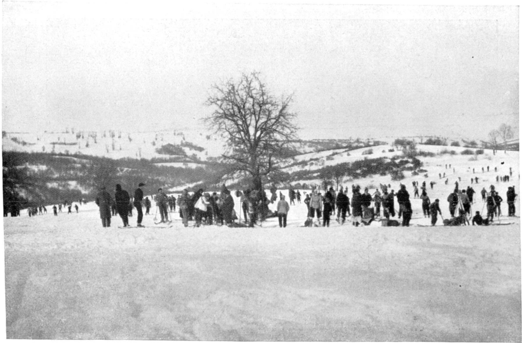
Ski en Bulgarie : Vue à l'Allin à 4 heures de l'après-midi. (Voir l'article page 48)