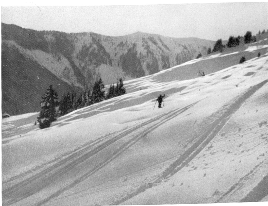
Skiberge um Saalbach: Abfahrt vom Zwölferkogel nahe der Akademikerhütte