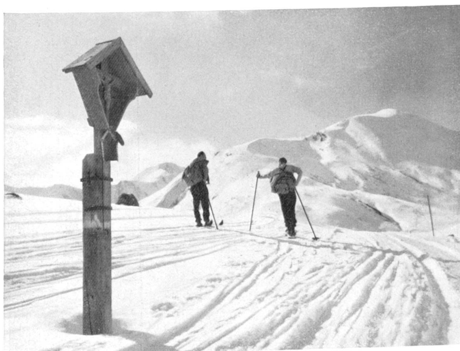
Skiberge um Saalbach: Am Gipfelkamm des Schattberges