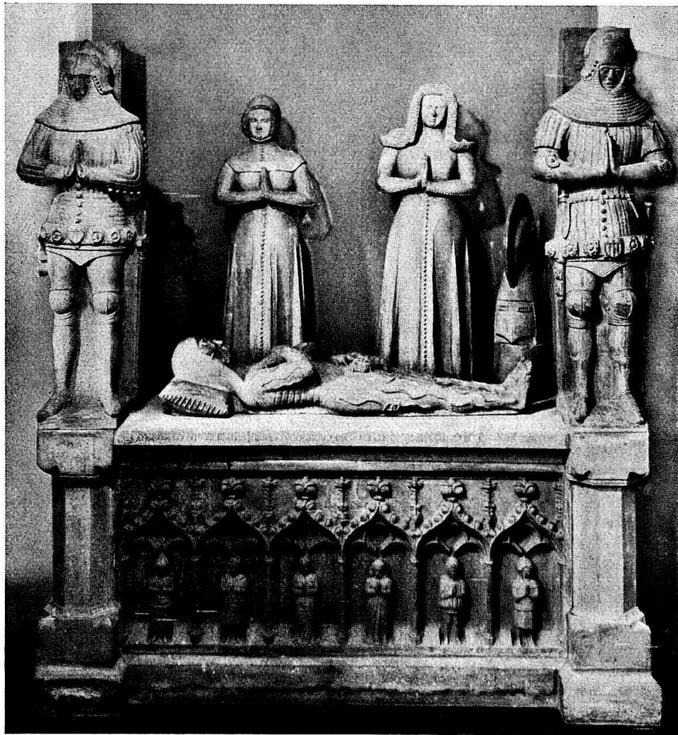
Abb. 2 Grabdenkmal Franz I. von La Sarraz († 1363) in der Kapelle des Schlosses Abguss im Schweiz. Landesmuseum

ihnen einen halb geöffneten Sarkophag mit einem in ein weisses Tuch geschlungenen Leichnam darin. Auf dessen Deckel steht: „Requiescant in pace“, auf der Stirnseite der Steinkiste: „SI QUIS ERIS, QUI TRANSIERIS, HAC RESPICE, PLORA. SUM QUOD ERIS, QUOD ES IPSE FUI, PRO ME PRECOR ORA“. Neben dem Sarkophag knien je zwei Canonici, hinter denen der heilige Hieronymus und der heilige Augustinus stehen 11) .