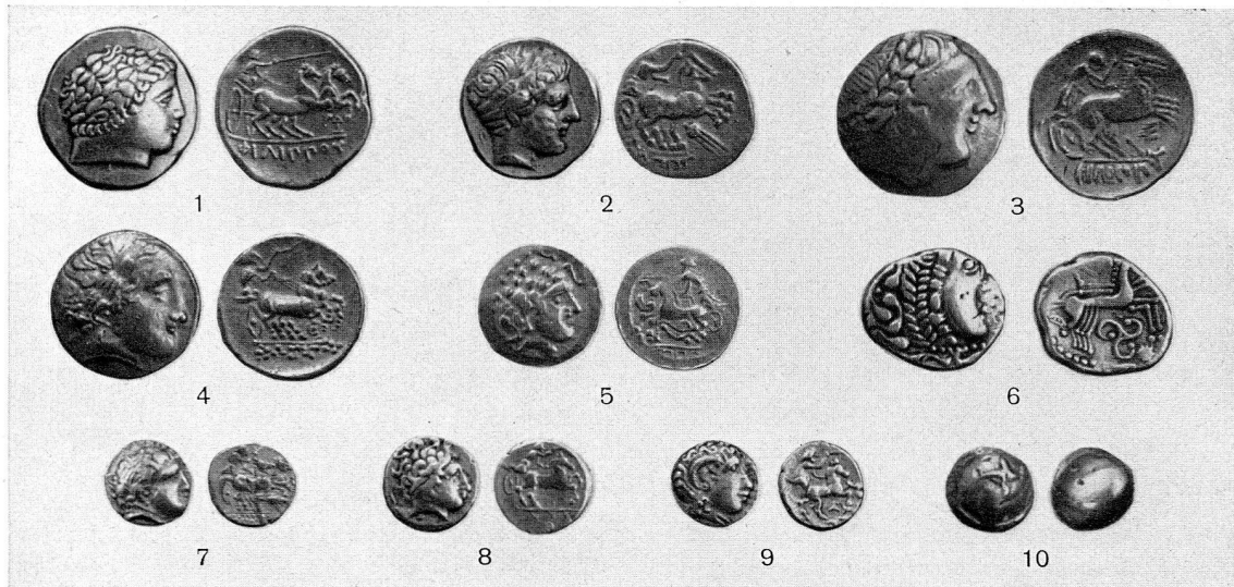
Abb. 21. 1. Protohelvetier?, Doppelstater 2. Arverner?, Stater 3. Volcae Arecomici, Stater 4. Protohelvetier, Stater 5. Helvetier, Viertelstater 6. Arverner?, Stater 7. Häduer, Viertelstater 8. Helvetier, Viertelstater 9. Sequaner, Viertelstater 10. Protohelvetier?, Bojer?, Stater. Alle in \frac{1}{4} nat. Gr. (S. 27)

Forschungen auf Kreta 1942, hg. von F. Matz. Berlin 1951