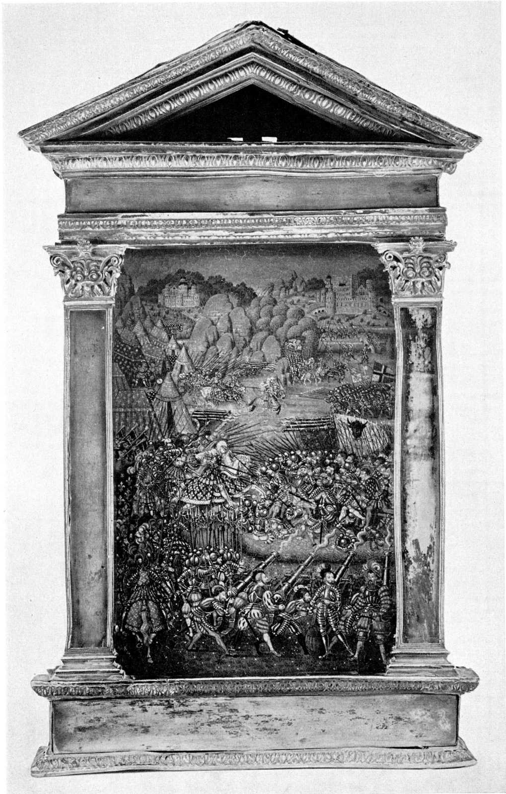
Abb. 1. Die Schlacht von Marignano, Tempera, in Silberrahmen. Französisch, um 1530 (S. 13)