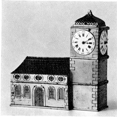
38. Schreibzeug mit eingebauter Uhr. Werk von Abraham Louis Tissot, La Chaux-de-Fonds. Um 1780 (S. 53)