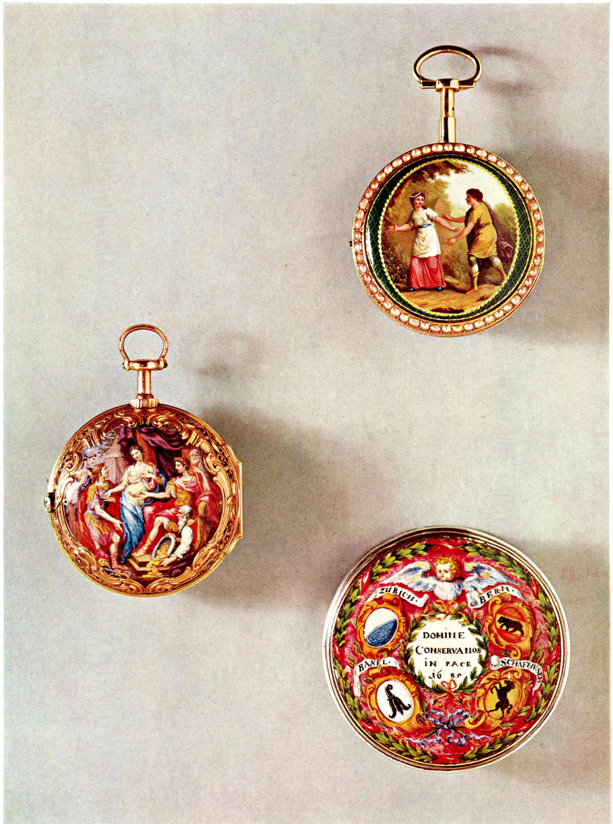
Oben rechts: Goldene Taschenuhr mit Emailmalerei. Arbeit von Guidon, Remond Gide et Cie, Genf, um 1810. Durchmesser 4,9 cm (S. 68)