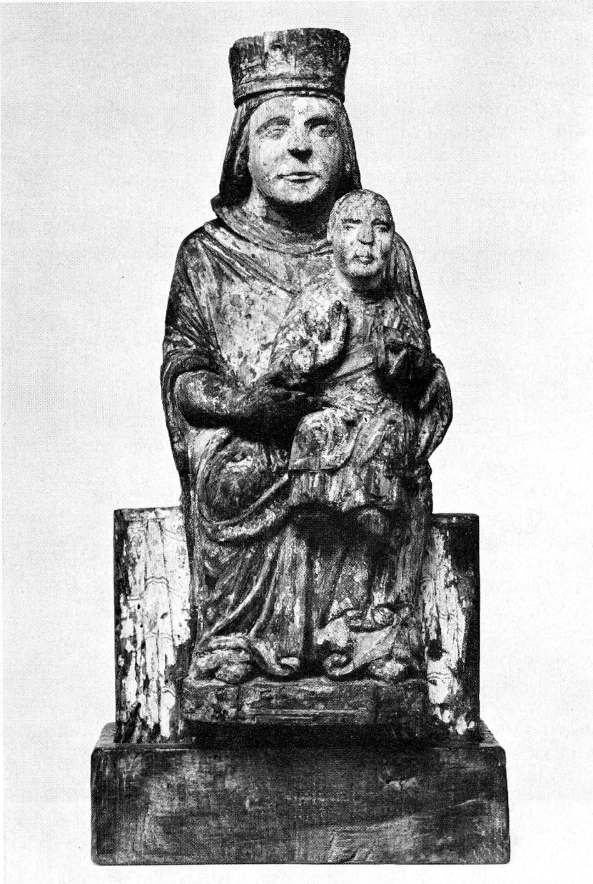
5. Madonna mit Kind. Pappelholz. Originale Fassung teilweise erhalten. 13. Jh. Höhe 48 cm (S. 22)

Meisen auf 26 913, was eine Gesamtzahl von 210 425 ergibt. Dieses schöne Resultat ist zum Teil auch den verlängerten Öffnungszeiten zuzuschreiben, die wir dank dem Verständnis der eidgenössischen Behörden am 1. Juli 1972 einführen konnten. Das Museum ist nun täglich von 10 bis 12 und von 14 bis 17 Uhr geöffnet, mit Ausnahme des Montagvormittags.