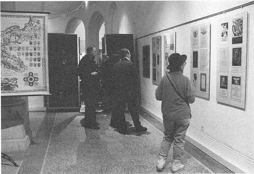
Abb. 12. Besucher in der Sonderausstellung «1.9.39. Ein Versuch über den Umgang mit Erinnerungen an den Zweiten Weltkrieg». (S. 20)

gen von Iwan E. Hugentobler. Die Ausstellung wurde vor allem von Veteranen des Aktivdienstes beachtet und besucht.