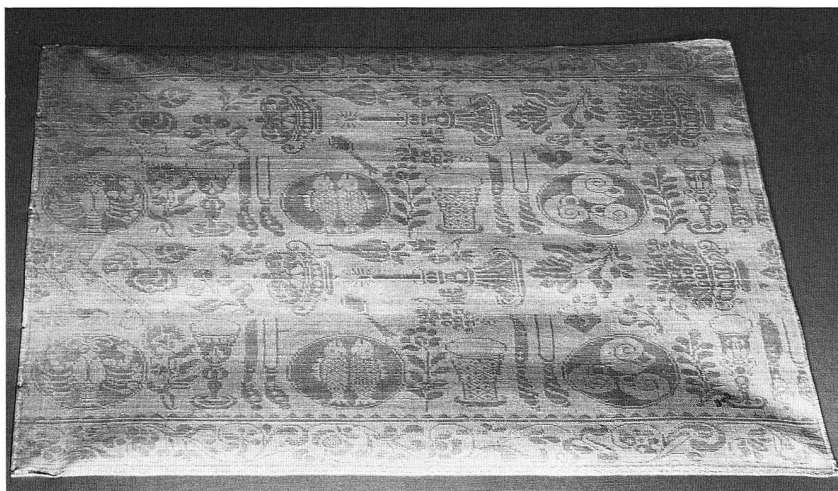
Abb. 14. Leinendamastserviette. Motiv des gedeckten Tisches. Um 1700. (S. 51, 66)