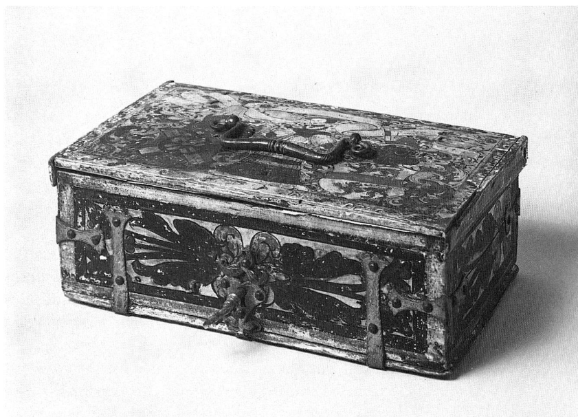
Abb. 13. Minnekästchen. Buchenholz und Eisen, auf Deckel bemalt mit Familienwappen der de Mestral Combremont. Datiert 1544. Länge 28 cm. (S. 48, 64)

Mit 23 635 Besuchern, einer stattlichen Zahl, bewegen wir uns im Mittel der vergangenen Jahre.