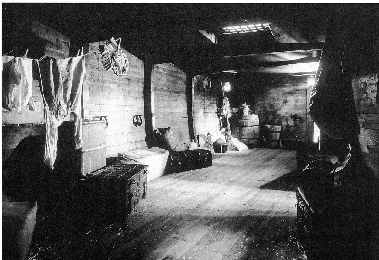
Abb. 3. Auswandererschiff in der Ausstellung 'Going West – Schweizer Volkskunst in Amerika'.

Den Abschluss der Ausstellungsreihe bildete die am 25. November eröffnete Schau 'Im Licht der Dunkelkammer – Die Schweiz in Photographien des 19. Jahr-