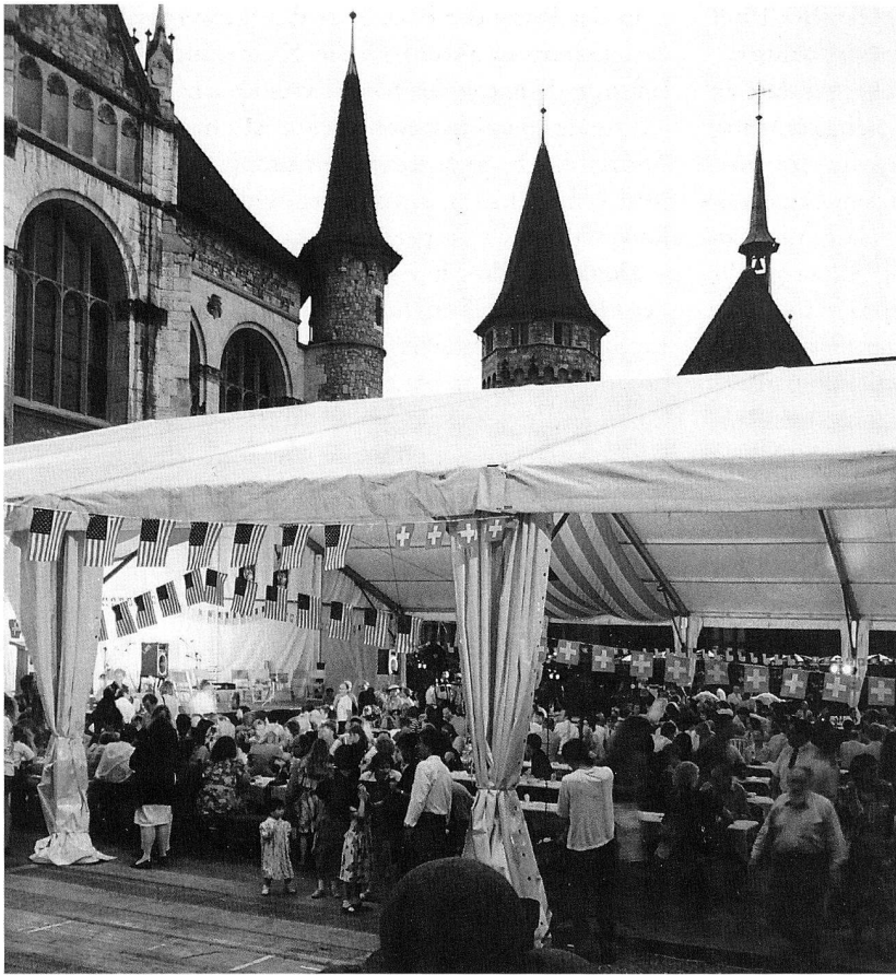
Abb. 1. Fest im Hof des Schweizerischen Landesmuseums zur Eröffnung der Ausstellung «Going West – Schweizer Volkskunst in Amerika».

veranstaltungen für Lehrkräfte aus verschiedenen Kantonen, die wir trotz dem stark reduzierten Angebot der Schausammlungen unverdrossen durchführten.