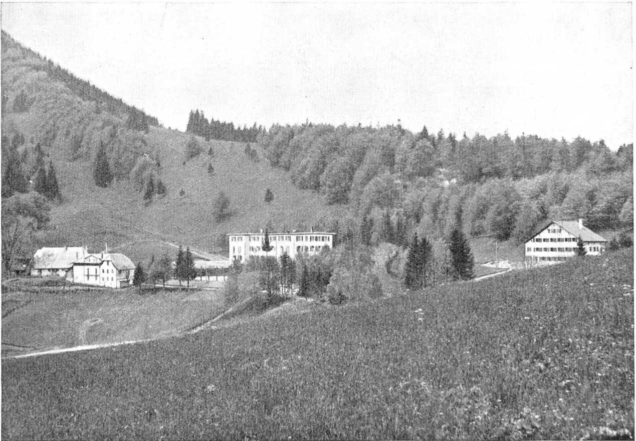
Ober-Balmberg, Kurhaus und Kinderheim.

So steht es in dem Briefe Carl Spittlers. Er war damals, als er mir diese Zeilen schrieb, 77 Jahre alt. Nun ist er schon lange tot; aber wer die Balmberge liebt, der liest gerne heute noch unter einer der weissen Kanzeln im Morgensonnenschein vom «Friedli, dem Kolderi», vom «Olympischen Frühling», oder wenn die Schatten um die Flühe lagern, suchen seine Augen Sonne in den farbigen «Schmetterlingen».