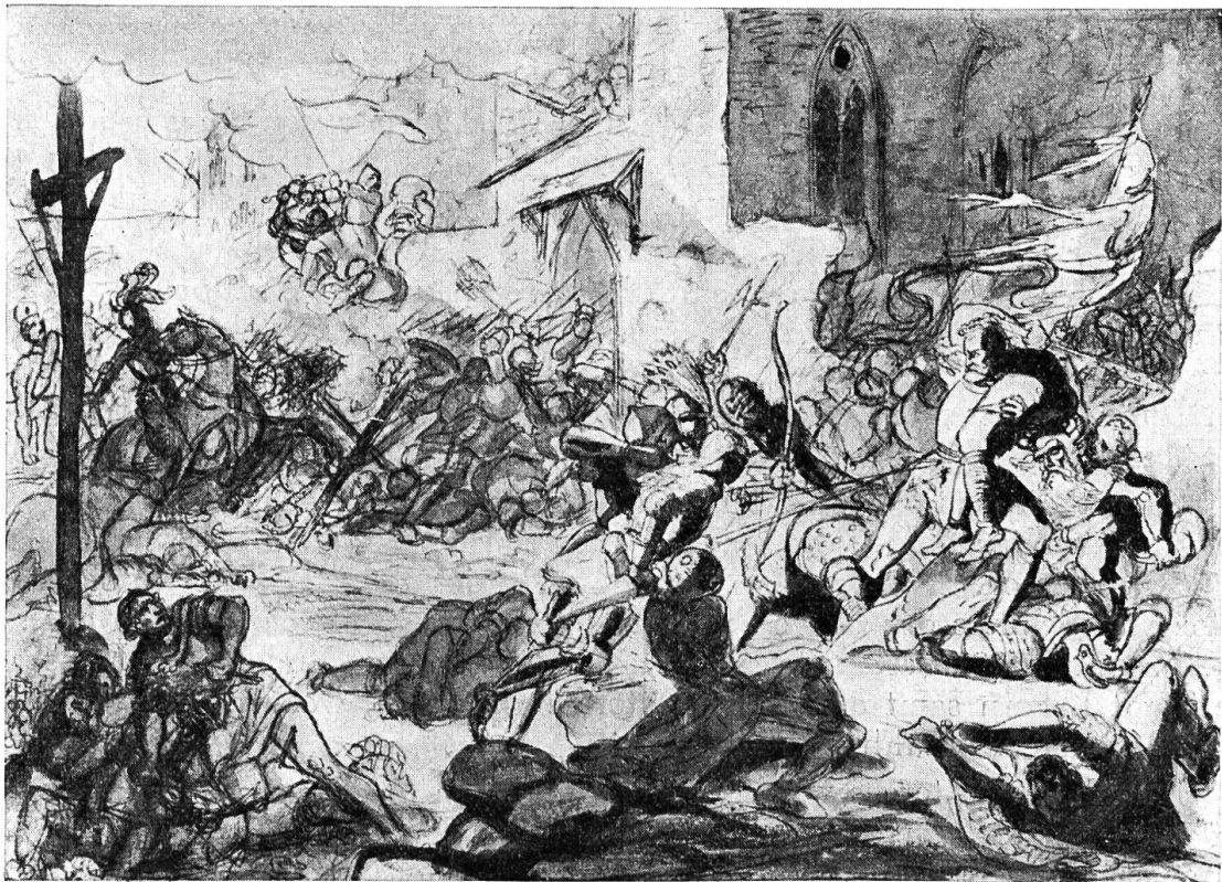
Die Schlacht bei St. Jakob an der Birs. Lavierte Federzeichnung von Martin Disteli.

wieder auf. Es war eine traurige Heimkehr, auch wenn die Gebäude nicht abgebrannt waren. Aber da stunden die Ställe leer, Keller und Vorratskammern waren ausgeräumt, Truhen und Kästen erbrochen, alles verwüstet! Der schöne Traubenertrag dieses Jahres musste grösstenteils an den Stöcken verderben, weil keine ganzen Fässer mehr vorhanden waren. Noch jahrelang machte allerlei Raubgesindel die Gegend unsicher, Leute, die in der Schule des Krieges Rauben, Brennen und Morden gelernt, die ehrliche Arbeit aber verlernt hatten.