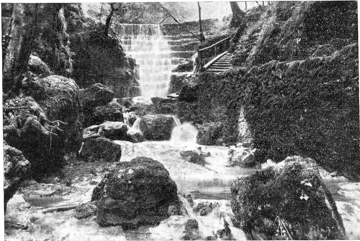
Partie aus der Teufelsschlucht.

des weiten Kirchensprengels (ehemals Kappel-Boningen-Gunzgen-Rickenbach-Wangen und Hägendorf) zum frommen Gottesdienste rief.