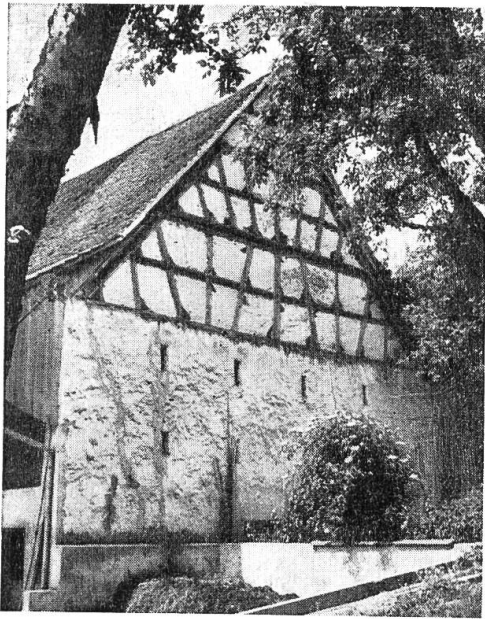
Riegelbau in Witterswil.

Mannigfaltig wie die Landschaft des Leimentals ist auch das Leimentaler Bauernhaus. Im Gegensatz zu vielen andern Gegenden, wo ein Haus dem andern gleicht, kann nicht von einem einheitlichen Typ des Leimentaler Hauses gesprochen werden. Die geographische Lage, die Nähe der politischen und sprachlichen Grenzen, die territoriale Zerrissenheit, die früher noch grösser war als heute, machten sich im Hausbau nicht weniger bemerkbar als in den sprachlichen Nuancen der einzelnen Dörfer.