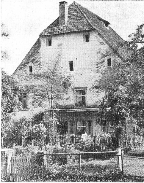
Das Gihrenhaus in Witterswil.

Ein grosser Teil des häuslichen Lebens spielte sich früher und vielerorts noch heute in der Küche ab, die man durch häufiges Weisseln, das meist am Karfreitag besorgt wurde, heller zu machen suchte. Kunstherde waren noch zu Beginn des letzten Jahrhunderts selten. Unter dem weiten Kaminschoss wurden Pfannen und Häfen über das offene Feuer gestellt oder an eine Kette gehängt. Das Kamin, sofern ein solches überhaupt vorhanden war, führte oft nur bis auf den Estrichboden, von wo der Rauch seinen Weg durch die Dachlücken suchte. Daher rührt in vielen alten Häusern das geschwärzte, vom Rauch imprägnierte Dachgebälk, von dem man oft annimmt, es deute auf einen einstigen Brand hin. In grossen Bauernhäusern liegen meist zwei oder gar drei Dachböden übereinander. Sie