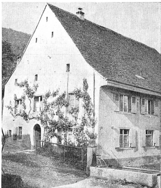
Haus Nr. 52 in Witterswil.

Mauerwerk, etwa ein Dutzend nur aus Fachwerk und die übrigen aus Mauer- und Riegelwerk. Die Einflüsse, welche auf den Hausbau bestimmend einwirkten, kamen aus dem Sundgau, dem Basbiet, der nahen Stadt und wohl auch aus dem welschen Jura.