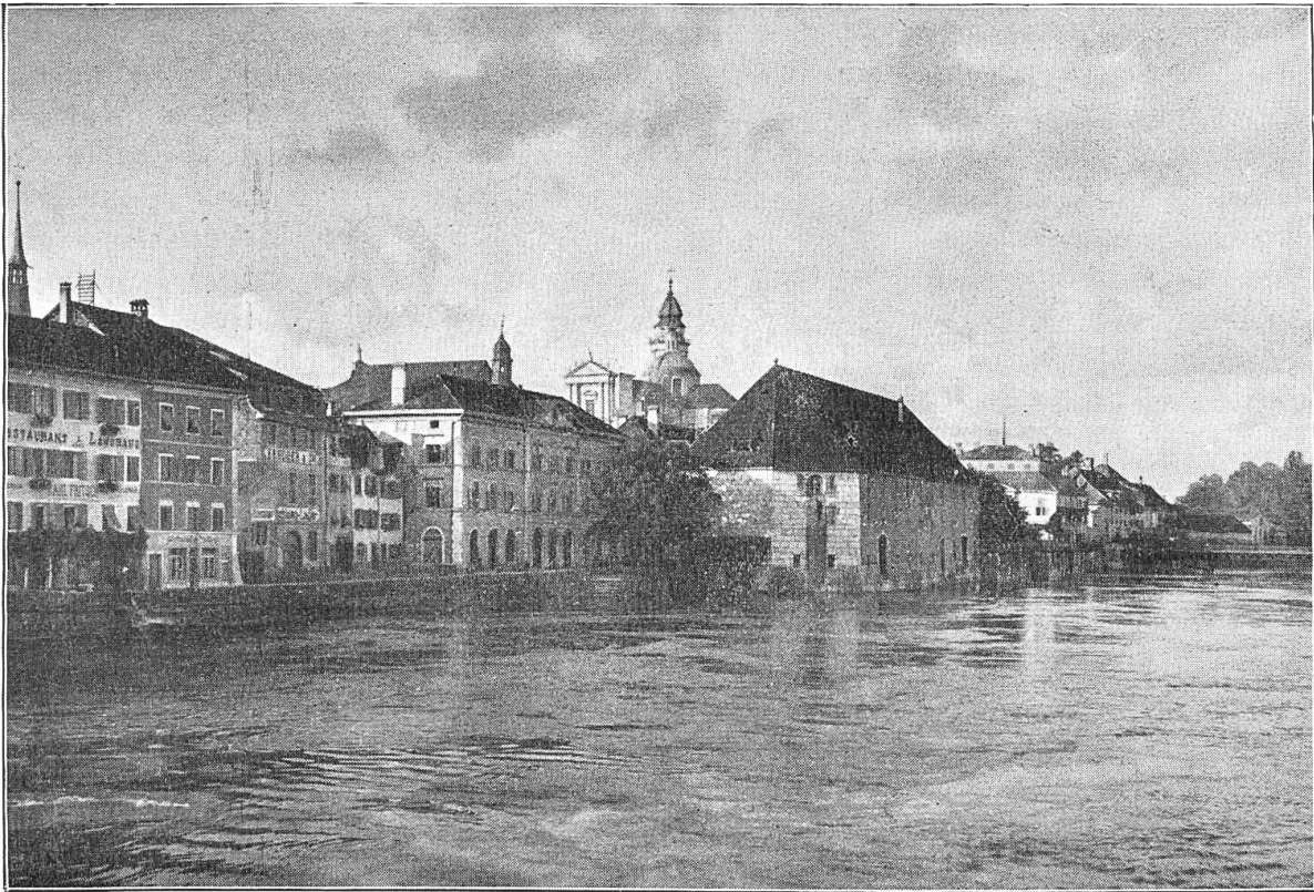
Solothurn. Blick auf das Landhaus und Sankt Ursen.