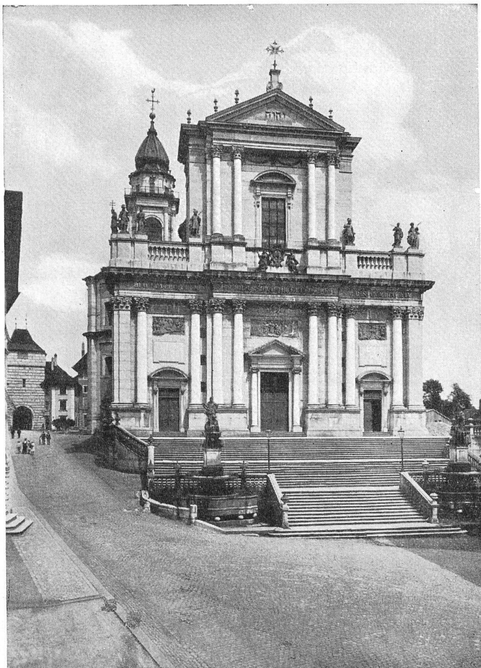
Solothurn. Sankt Ursen.

staut wurden. Vorbei die alte Herrlichkeit! Napoleon schrieb der Schweiz die neue Verfassung vor. Unser Vaterland wurde sozusagen zu einem Protektorat. Aber als der Uebermut des Europasiegers sich rächte, als die letzte Völkerschlacht verloren, da schien auch unsern gnädigen Herren noch einmal die gute Zeit zu blühen; doch nicht für lange; sie brachte wenig Frucht, und der harsche Wind der dreissiger Jahre fegte die dünnen Aeste alter Herrlichkeit hinweg. Eine neue Zeit begann, die Zeit, da das Volk seine Stimme, sein Recht, seine Befreiung vom Drucke der alten Vorrechte empfing. Hier, beim Franziskanertor, hat der Volksfreund Josef Munzinger, der spätere Bundesrat, das sogenannte Oltnerloch in die Ringmauer geschlagen, das sollte heissen: Volk, ströme durch das Tor herein, dein Platz ist frei!