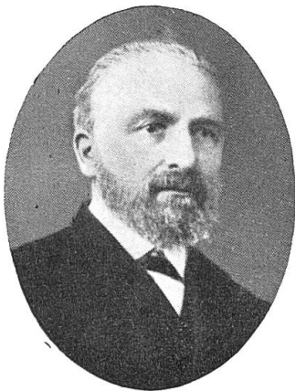
Bonaventur Baumgartner, von Oensingen, Landammann, 1823 – 1884.

Bauern aus der ganzen Schweiz steigen aus. Es sind die Abgeordneten der verschiedenen Kantone zur Jahresversammlung des schweizerischen landwirtschaftlichen Vereins. Am Samstag, den 27. Oktober, tagten die 50 Abgeordneten unter dem Vorsitz ihres Präsidenten, Regierungsrat B. Baumgartner, im Hotel Krone.