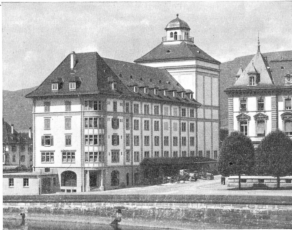
Das Lagerhaus in Solothurn.