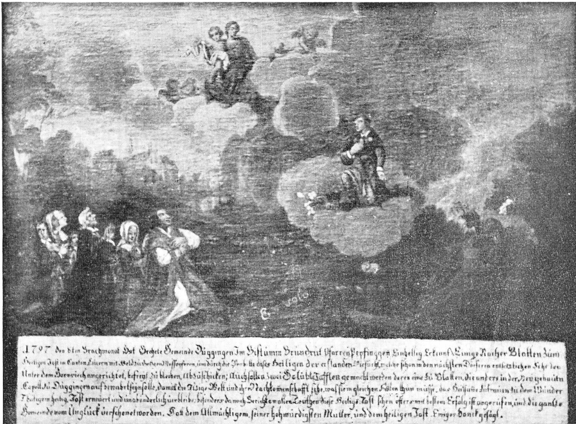
Votivbild in der Pfarrkirche Duggingen im Berner Jura, 1797.