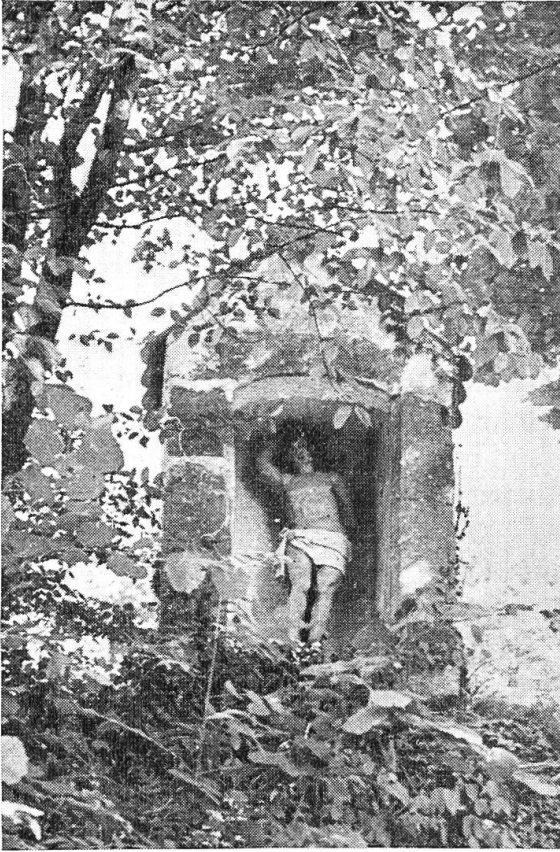
Bildstöcklein beim Rotberg.

auf (Näheres bei E. Baumann, Geschichte der St. Wendelinskapelle Kleinblauen. Laufen 1945).