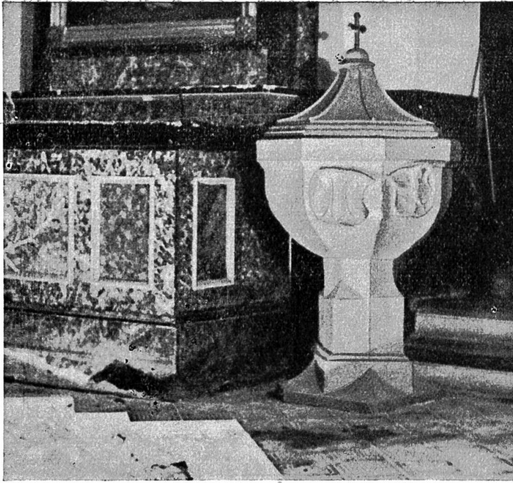
Abb. 2. Taufstein der Kirche in Oberdornach. Mit den Wappen der Familien von Efringen und Salzmänn. Um 1470.

Kirche von Dornach begraben wurde. Der schöne, auf Kosten Bernoullis vom Steinmetzen Jacob Umbher aus Dornach geschaffene Grabstein wurde 1826 kopiert und ist in dieser Form an Ort und Stelle noch erhalten (Abbildung 1). Er erinnert an einen der grössten Naturforscher seiner Zeit, der durch eine Expedition nach Lappland die Abplattung der Erde bewiesen hatte und dadurch Weltberühmtheit erlangte. Ein im Besitze der Familie Bernoulli noch erhaltenes Porträt zeigt den Franzosen denn auch in lappländischem Kostüm.