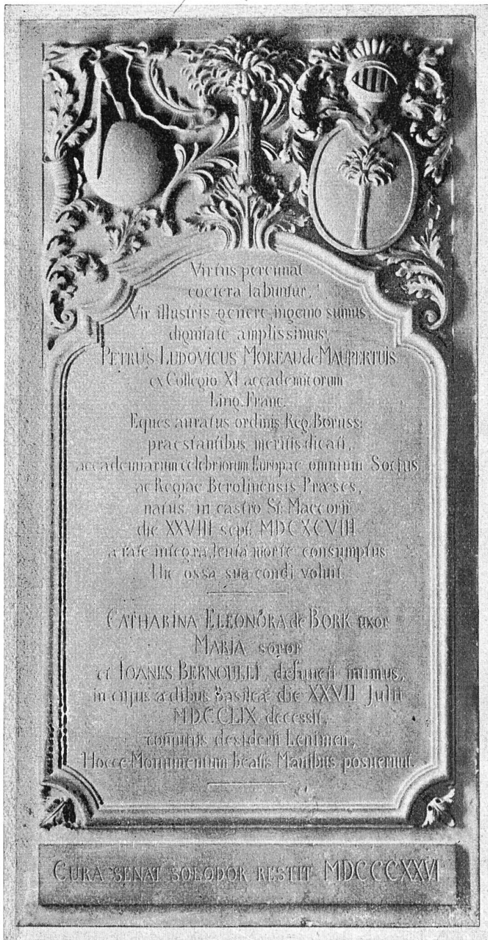
Abb. 1. Epitaph von Maupertuis. Kopie von 1826 nach dem Werke des Jacob Umbher von 1759.

Die Kirchen von Oberdornach und Arlesheim sind schon auf dem Dornacher Schlacht - Holzschnitt dargestellt. Diese Abbildungen gehören also zu den ältesten topographischen Dokumenten, die uns überhaupt erhalten sind. Die Stadtansichten der kurz vorher in Nürnberg erschienenen Schedel'schen Chronik sind noch auffallend schematisch gehalten, während auf dem Schlacht - Holzschnitt die Käsbissentürme der Mauritiuskirche von Dornach und der alten Ottilienkirche von Arlesheim neben dem grünen Berg- hang das Bild beherrschen. Bei Arlesheim lässt sich der Holzschnitt aus dem Jahre 1499 oder 1500 noch genau anhand der Zeichnung kontrollieren, die Büchel 1754 von der alten Kirche festhielt. Die Zeichnung von Büchel zeigt die alte Kirche mit dem neuen Dom auf einem Blatt. Neben dem über- ragenden Neubau nimmt sich die schlichte Landkirche sehr bescheiden aus, und man wird daher begreifen, dass sie allmählich zerfiel und schliesslich abgerissen wurde. Aber die Kirche von Dornach steht noch heute und soll nun als Heim-