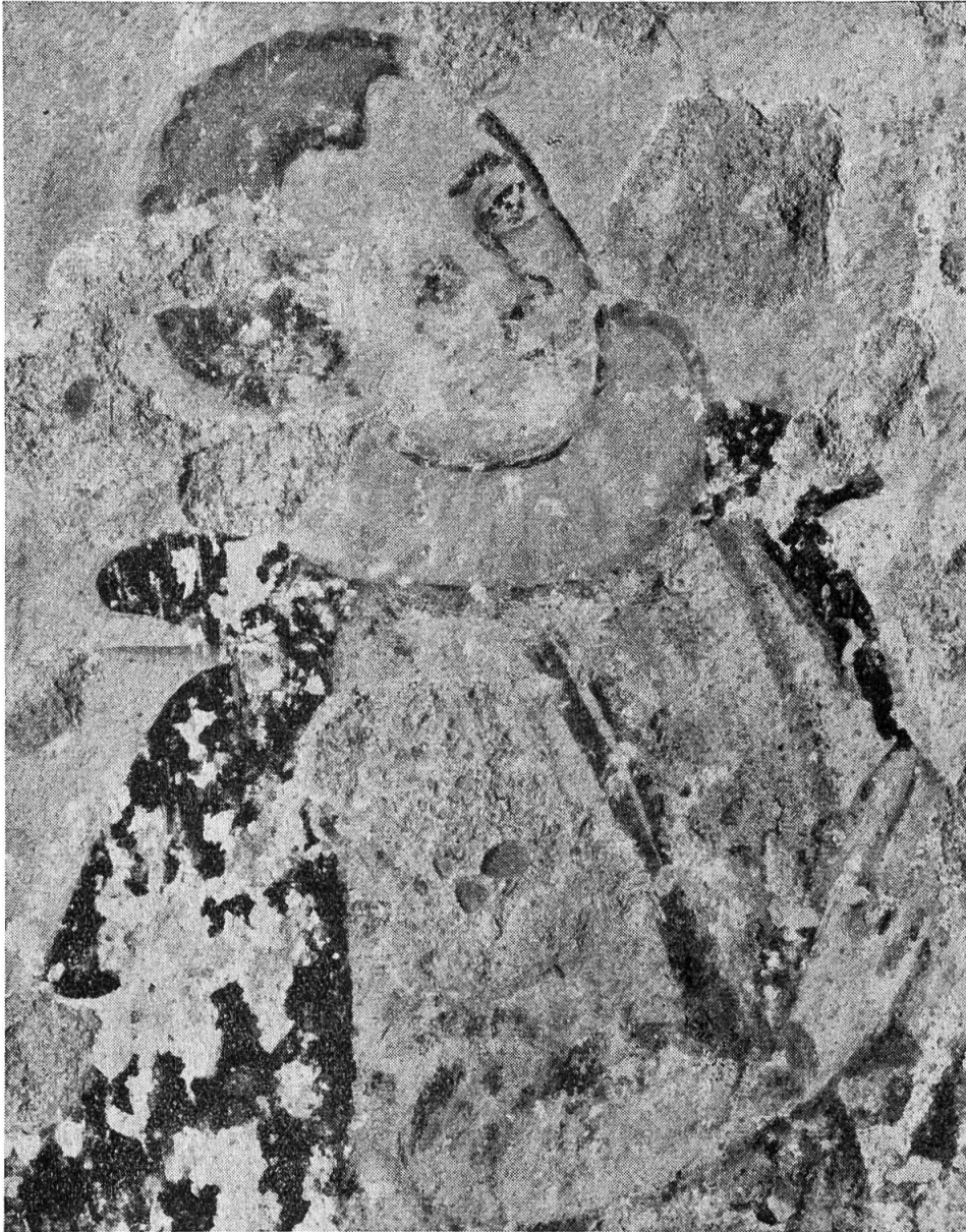
Abb. 3. Kind des Landvogts Gibelin 1597.

Ausschnitt aus dem Wandbild an der Südwand der Kirche in Oberdornach.