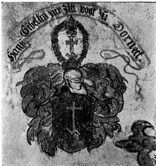
Abb. 10. Wappen des Vogtes Hans Gibelin.

Zu beiden Seiten des Wandbildes links und rechts unten sind die Wappen der Familie angebracht.