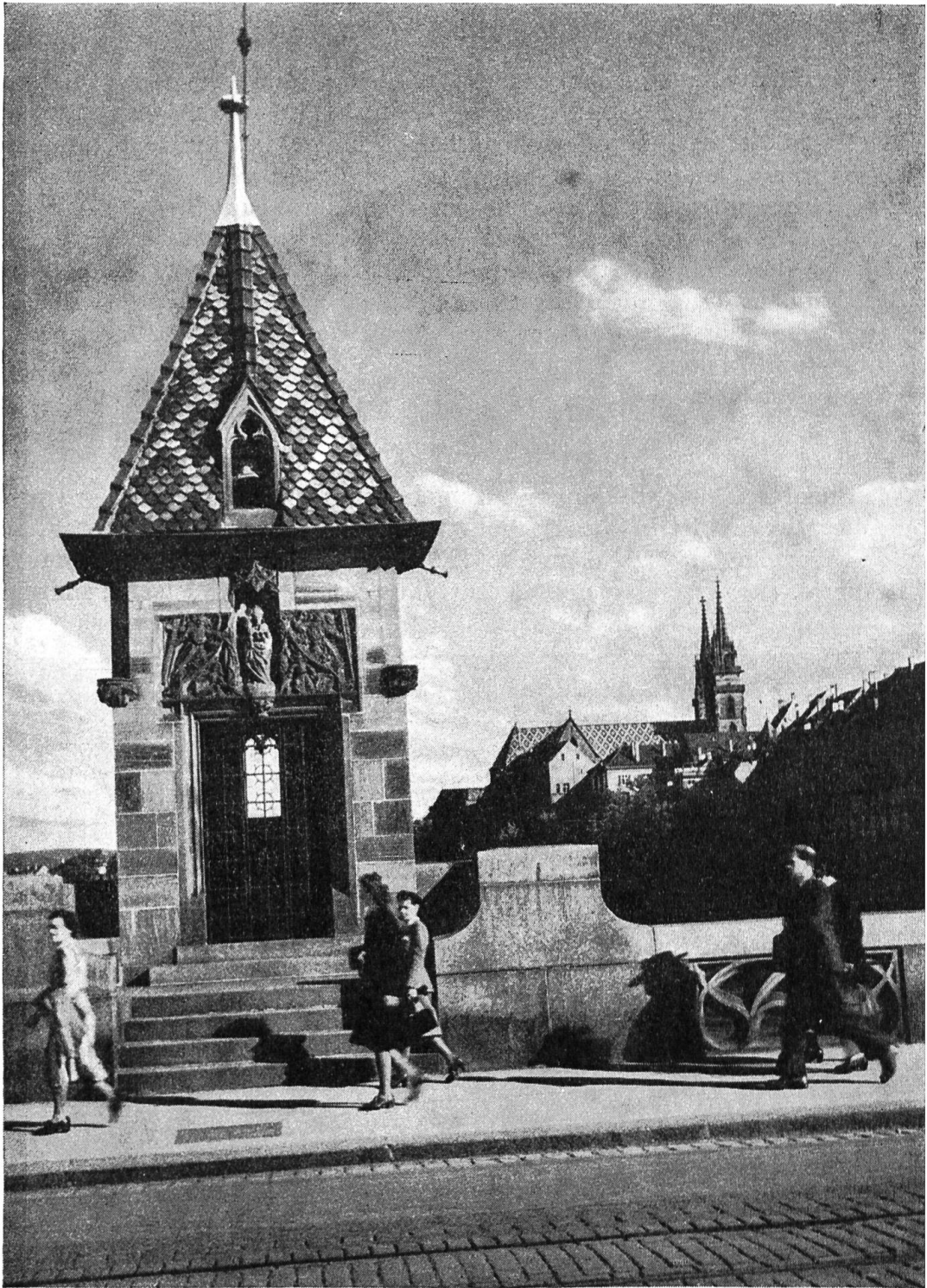
Das Käppelijoch auf der mittleren Rheinbrücke mit Blick auf das Münster.