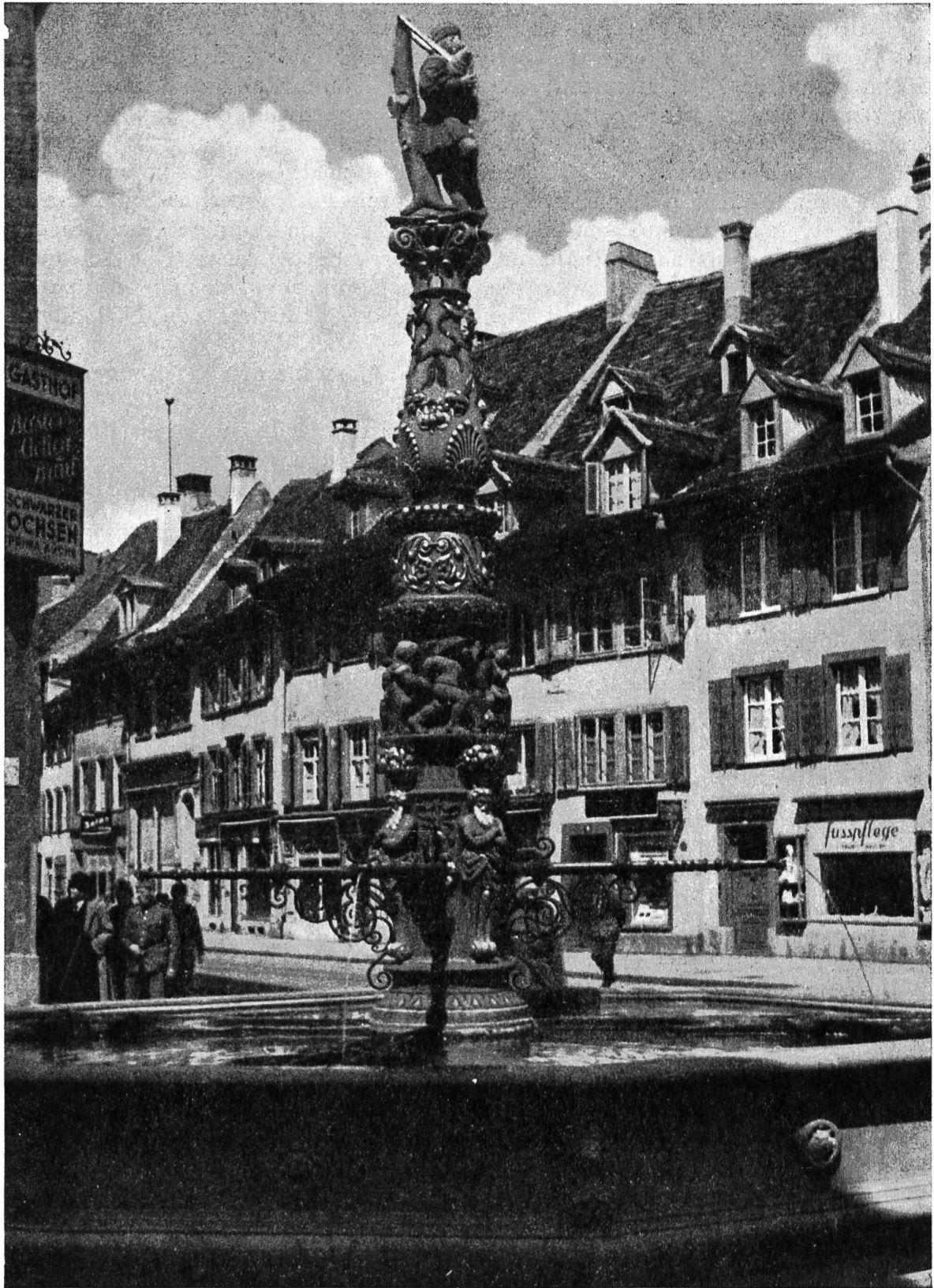
Der Holbeinbrunnen in der Spalenvorstadt.