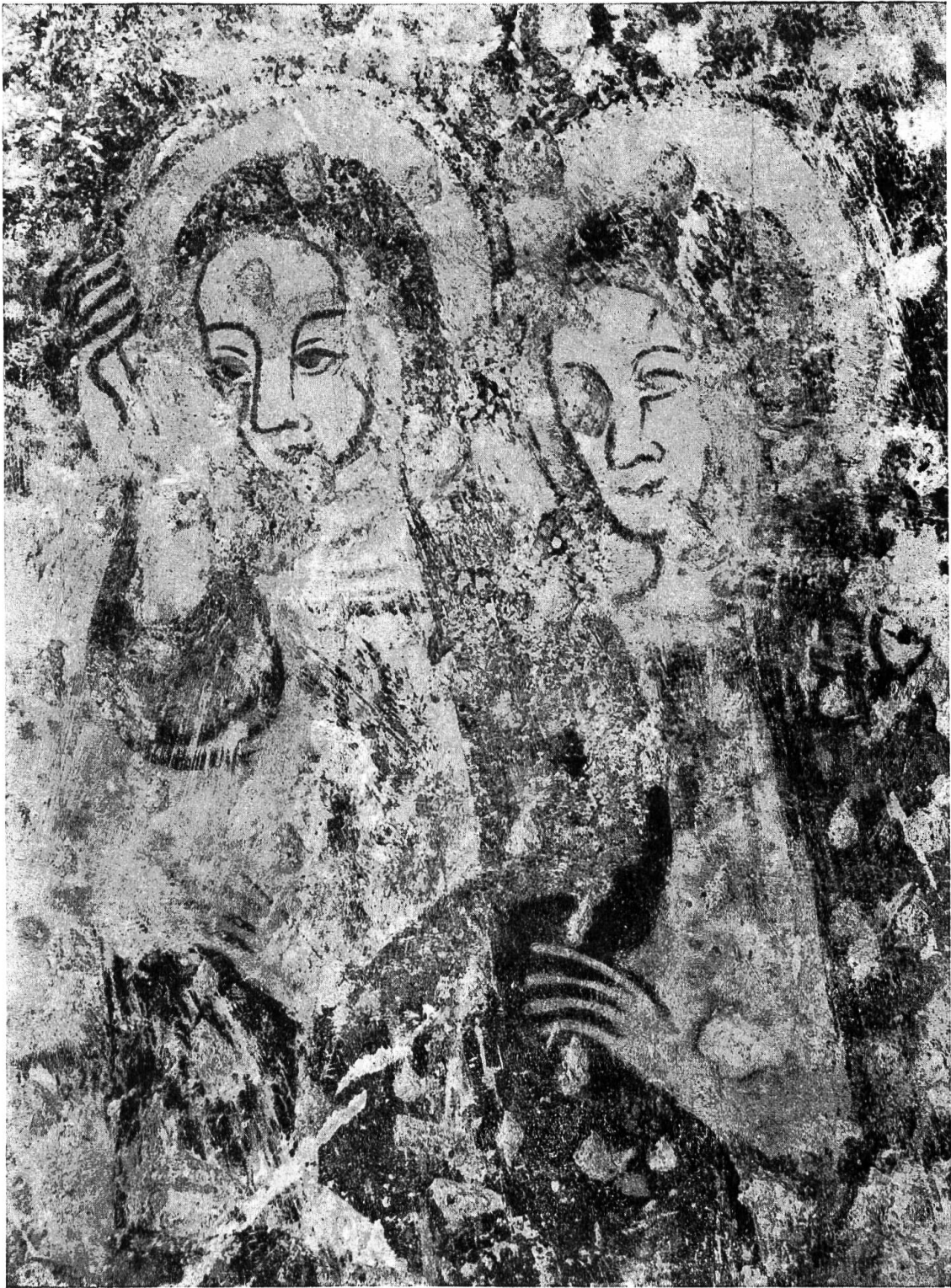
Maria und Martha.

Ausschnitt aus dem Fresko «Auferweckung des Lazarus» in der Kirche zu Ziefen.