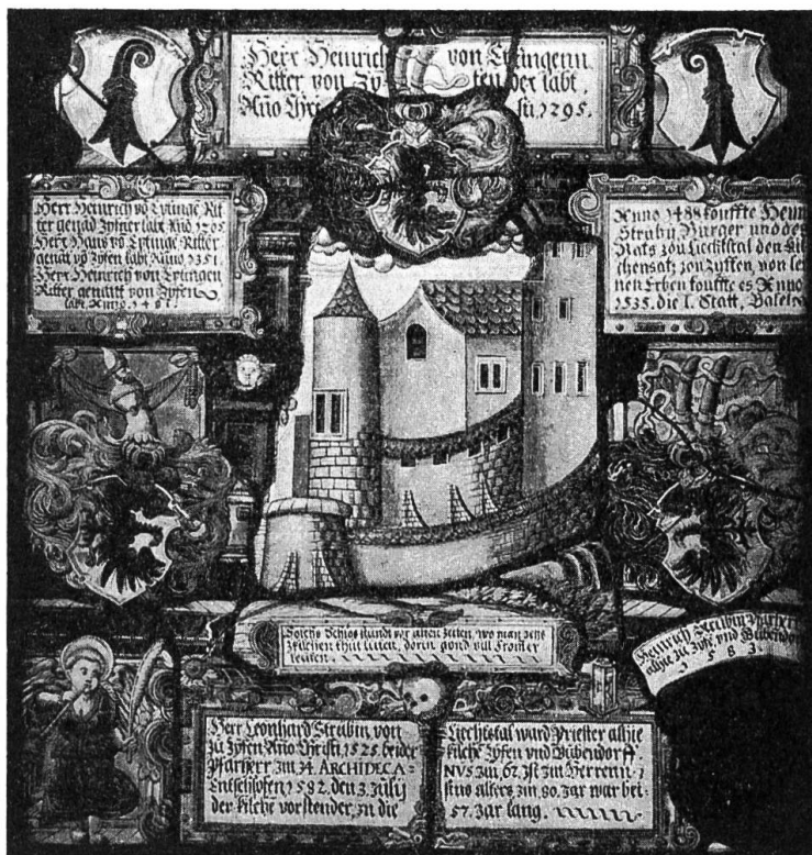
Strübin-Scheibe von 1583.

In der Mitte das Phantasiebild der angeblichen Eptingerburg zu Ziefen. Original auf Schloss Wildenstein.