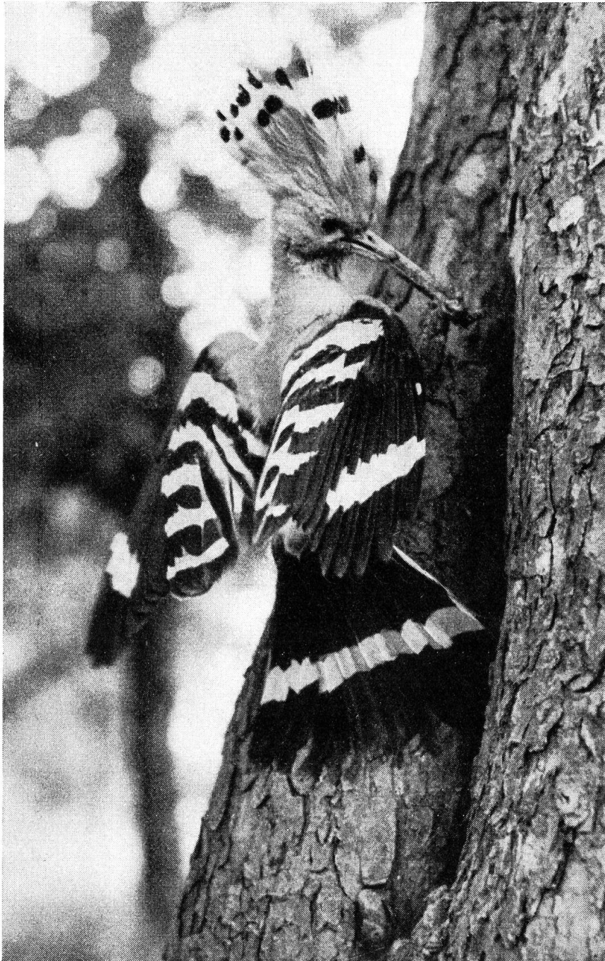
Wiedehopf an der Nisthöhle

Ueber dem Eichwald tönt ein hoher Triller. Zwei große, düstere Vögel kreisen über den Bäumen. Ihr Flugbild erinnert an den Gabelweih. Doch sind sie etwas kleiner, der Schwanz ist nur schwach gegabelt, ihr Kleid nicht bunt, sondern dunkel, gegen den hellen Himmel fast schwarz. Es sind