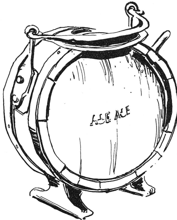
«Lögeli» aus der Sammlung Erzer in Dornach Federzeichnung von G. Loertscher

Schöpfung eines gewandten Küfers handelt. Wohl ist der Küfer aus unsern Dörfern verschwunden, doch hat sich sein Andenken als Dorfname «s Chiefers» erhalten. Der Volkskunstschnitzer war im Schwarzbubenland eine seltene Erscheinung. Von den Kruzifixen und Geigen, die ein gelähmter Bärschwiler im letzten Jahrhundert hergestellt hat, sind leider keine Zeugen mehr vorhanden. Sie wurden schon vor Jahren von Altertumskrämern in die Stadt geschleppt und in klingende Münze umgewandelt.