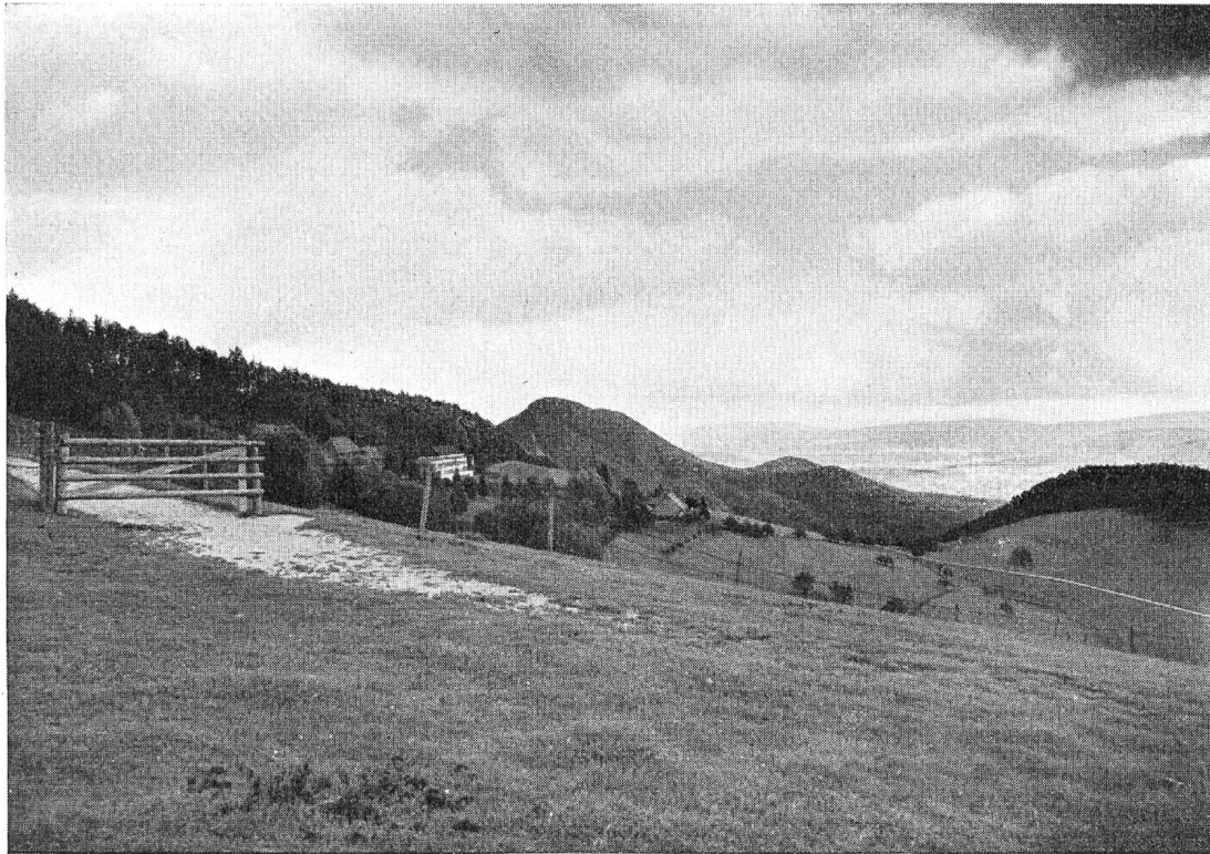
Die Mulde des Allerheiligenberges Blick gegen Osten mit Olten und dem Engelberg