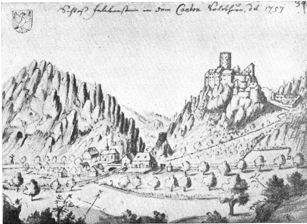
Schloß Neu-Falkenstein mit St. Wolfgang um 1757, nach Emanuel Büchel

sicht. Hinter Aarau fließt die Aare noch eine Meile zur Rechten, ungefähr bis Schönewirth, eine kleine Stunde weit. Nachher dreht man sich mehr links, bis Olten, ein Städtchen 2½ Stunden von Aarau. Hier fahren Sie links an einem kleinen Bergrücken weg. Von dieser höheren Gegend haben Sie eine angenehme Aussicht auf das Thal, in welchem Olten jenseits der Aare zur Rechten liegen bleibt . . . Auf der Höhe von Olten zeigt sich rechts der Arm des Jura-Gebirgs, zu welchem der Hauenstein gehört. Man erkennt sogar die Stelle, wo eine Kluft durch den Felsen gehauen, den engen Paß bildet, der allein in diese Ebene führt.»