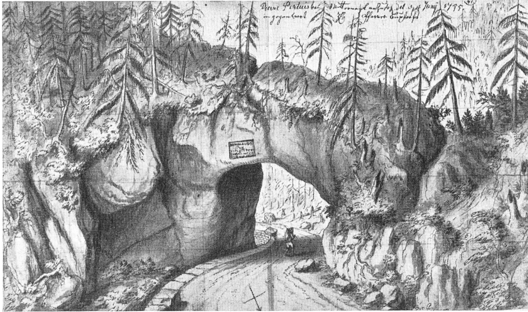
Die Pierre Pertuis, 1755 Zeichnung von Emanuel Büchel

«Was ein Vergrößerungsglas, das thut die Wissenschaft; Durchgehn sie Menschenwerk und die von Gottes Kraft; In jenen werden sie die grobe Kunst beschämen, In diesen machen sie die Wunder zuzunehmen.»