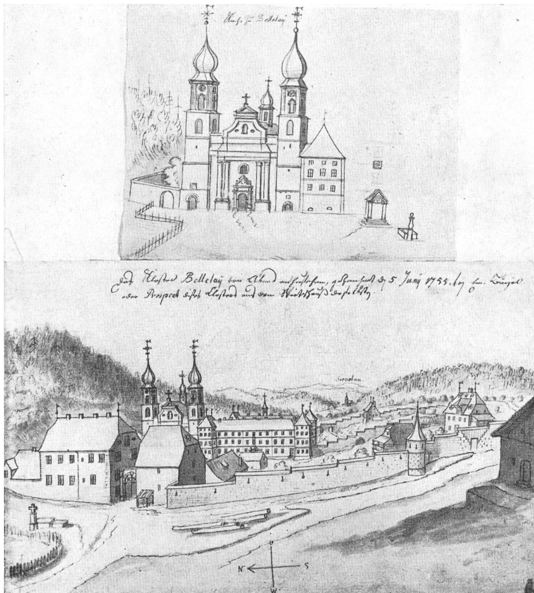
Kloster Bellelay, 1755 Zeichnung von Emanuel Büchel

und etwas weniger Pasche und Haber, aber sehr wenig Roggen. Die Viehzucht ist hier stark, sonderlich wird viel gemästet und an dem berühmten Chindon Markt an ausländische Viehhändler und Mezger verkauft. Das Fleisch von den Schaafen, welche auf den Bergen, sonderlich aber um Tachsfelden herum, zu Weide gehen, ist das allerschmackhafteste und wird mit Recht allen andern vorgezogen. Die auf den Bergen verfertigten Käse und insbesondere die sogenannten Bellelaykäse, noch mehr aber die Frauenkäse werden gelobt. An