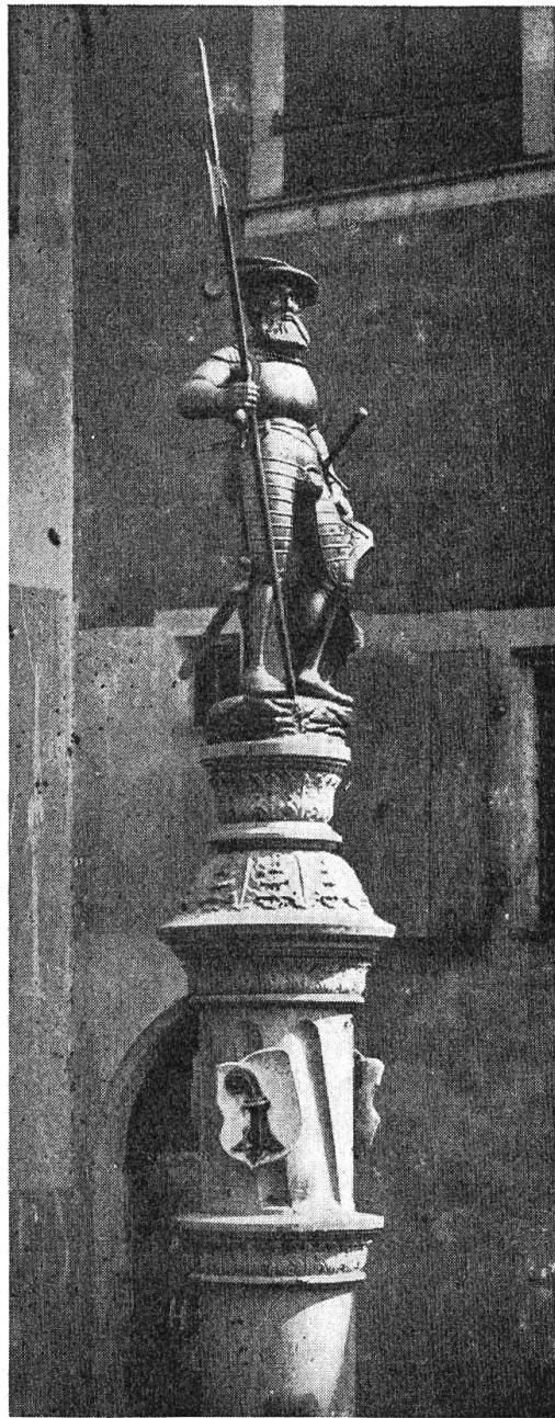
Säule und Figur des Kornmarktbrunnens vor der Versetzung auf den Martinskirchplatz. Statue von 1546/1547.

Weiterhin ist darauf hinzuweisen, daß vom 14. Jahrhundert an bis zur Reformation auf dem Kornmarkt in Basel ein Bildnis (eine Malerei oder