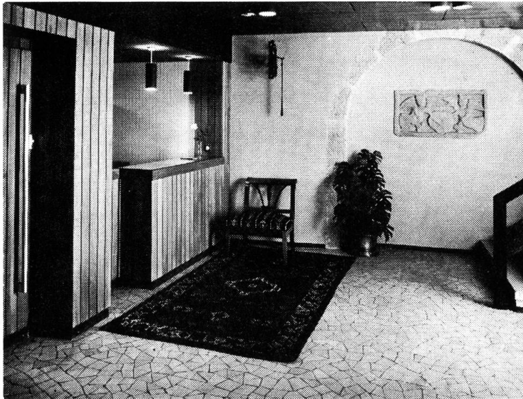
Hotel Roter Turm. Eingangshalle mit Relief der Schützengunft von 1587.

len Hinweisen. So wurden Spuren aus der Bronzezeit festgestellt sowie Mauern einer römischen Hafenanlage für die Flusschiffahrt. Der Zeitglockenturm stammt aus der burgundischen Zeit, als Teil der Stadtburg von den Herzögen von Zähringen errichtet; so könnte das Nebenhaus als ursprüngliche Burgschenke vermutet werden.