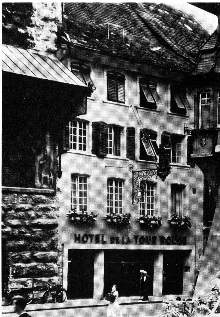
Hotel Roter Turm.