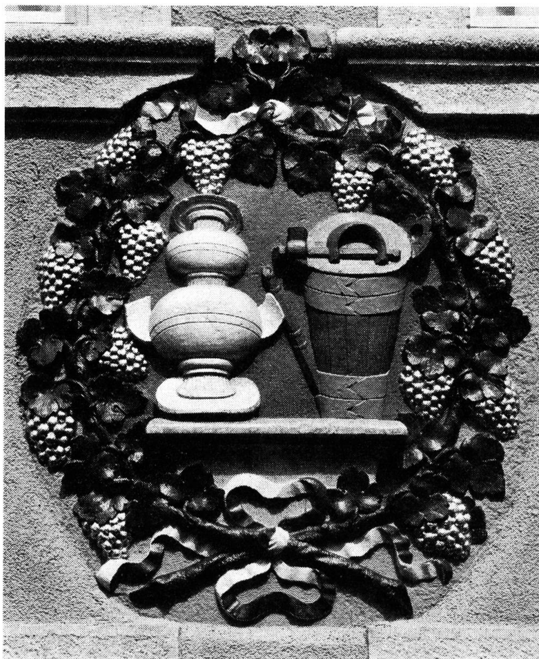
In Stein gehauenes und bemaltes Zunftwappen am Zunftthaus zu Wirthen.

es die Aufgabe der Zunft, den durchziehenden Handwerksburschen auf der Walz Obdach und Zehrung zu gewähren. Aus diesen Begegnungen ergab sich der nötige Wandel: die Innung behielt den Arbeitsmarkt im Griff, überwachte und beeinflusste die Rotation und löste damit das brancheeigene Personalproblem. Besonderes Gewicht schenkte man der Abschirmung gegen aussen, gegenüber Handwerkern aus benachbarten Landsgemeinden und «Stümplern», also den nicht vorschriftsgemäss Gelernten. Eine Handfeste der Küfer von 1688 forderte, dass den «äusseren Meistern . . . in der Stadt und Bürgerzahl . . . alle Arbeit gänzlich untersagt und verboten sein solle . . . allein zugelassen solle sein, die neuen Fässli, Kübel, Zuber, Bütti und andere dergleichen Küferarbeit zu machen und am gewöhnlichen allhiesigen Wochenmarkt, wie bisher feilzuhalten und zu verkaufen».