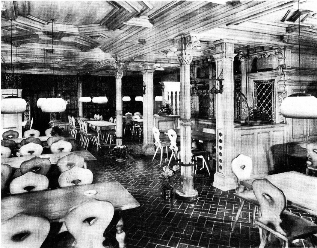
Zunftthaus zu «Wirthen». Das Restaurant im Stil einer altdeutschen Stube.

Wirte übernommen werden konnte. «Am 2. August 1527 wurde den Weinschätzern «am Land» ein Eid auferlegt, Landfass, Ryffass und Elsässerfässli in die Beylen zu schlagen und den Wirthen ungeschätztes Einlegen zu verleiden».* Sinner hiessen die Eichmeister. Ihre Aufgabe war es, «alles Weingeschirr zu sinnen» und mit dem obrigkeitlichen Brennzeichen zu versehen. Die Einlässer liessen den Wein ein, d.h. sie besorgten das Hinunterlassen der Fässer in die Keller der Wirte. Gleichzeitig übten sie das Amt der Getränkepolizei aus, indem sie den Obern die schuldigen Zoll- und Verbrauchssteuern melden mussten.