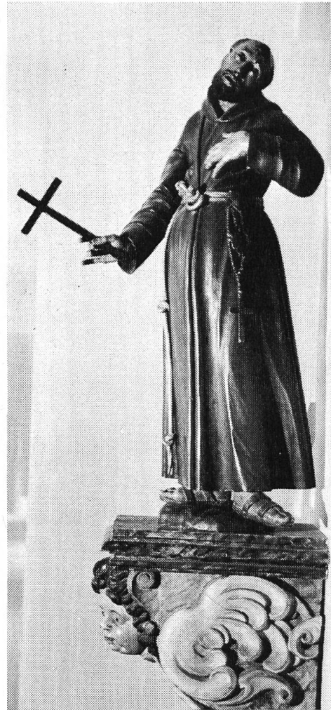
Franziskusstatue im Kapuzinerkloster Dornach Ende 17. Jh.