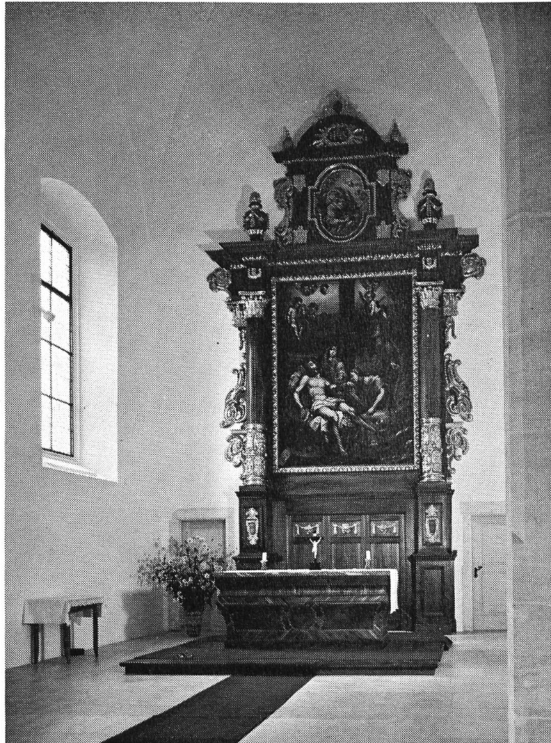
Hochaltar der Kapuzinerkirche nach der Los-trennung des Stipes.

die Rückkehr der schweizerischen Mitbrüder aus dem Elsass von 12 auf 21 gestiegen war, kaum mehr für den Lebensunterhalt. Es legt ein Zeugnis für die bessere konfessionelle Atmosphäre ab, dass der Guardian P. Clemens 1747 den Rat der Stadt Basel um Unterstützung anzufragen wagte und dieser die Angelegenheit «dem Direktorio der Schaffneynen» empfahl. Alljährlich zur Zeit der grossen Messe durften damals die Kapuziner in Basel an den Marktständen die verschiedenartigsten Utensilien erbetteln und für die katholischen Krämer die Messe feiern. Vermehrte Leistungen der Gemeinden, private Wohltäter und eine Reduktion des Bestandes halfen schliesslich über die materielle Not hinweg.