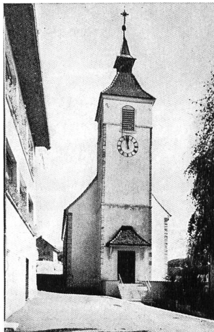
Blick in den Chor nach dem Wechsel der Ausstattung. Äusseres von der Turmseite nach den Restaurierungsarbeiten.

Abbruchobjekte sein müssen, ist in Himmelried ebenfalls bewiesen — allerdings nicht von Einheimischen, sondern von einem Basler Akademiker, welcher eine Hausruine gekauft und gediegen restauriert hat und sie jetzt bewohnt. Wird das Beispiel den Eingesessenen den Star stechen?