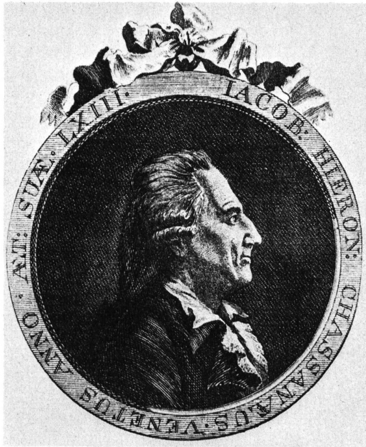
Casanova im Alter von 63 Jahren