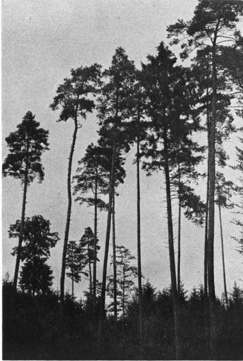
Der Wald ist Erholungsgebiet und biologischer Erneuerer unserer Atemluft!