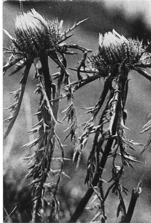
Die Silberdisteln sind eine Zierde unserer Juraweiden; sie stehen unter Naturschutz.

Hut steckte, und den die Alten «Hexle» oder Totenvogel nannten, weil sein unheimlicher Ruf in der Nacht das Sterben ankündigte. Wir kommen zu einem Bächlein. Hier fließt das Wasser noch über den moosigen Stein. Keine Verschmutzung, keine Waschmittelschaumkrone ist bis hierher hochgekommen, das kommt vielleicht erst später, wenn der Fortschritt noch weiter anhält. Im Frühling ist hier alles gelb. Tausende von Dotterblumen oder Bachbummeln, wie sie bei uns heißen, verwandeln das Bächlein in eine Märchenwelt. Leicht steigt der Weg jetzt hinan. Wir machen eine Verschnaufpause, schauen uns im Kreise um und erleben die Pracht eines Jura Herbstes, gleich einer Palette schönster Farben, wie sie kein Maler zu malen vermöchte. Wir steigen höher. Da sind schon die ersten Silberdisteln und dort die Sträucher mit Hagebutten, die im Sommer als Heckenrosen unsere Bewunderung erregen. Kindererinnerungen werden wach; eine Konfitürenschnitte mit Buttenmost, ach wie war das fein! Das schon lange vernommene Herdengeläut weidender Kühe wird lauter. Der ganze Stolz eines währschaftigen Bauern weidet hier. Das würzige und saftige Gras verspricht allerbeste und gesunde Milch. Da stehen auch die gelbblühenden Stengel der Enziane. Aus ihren Wurzeln