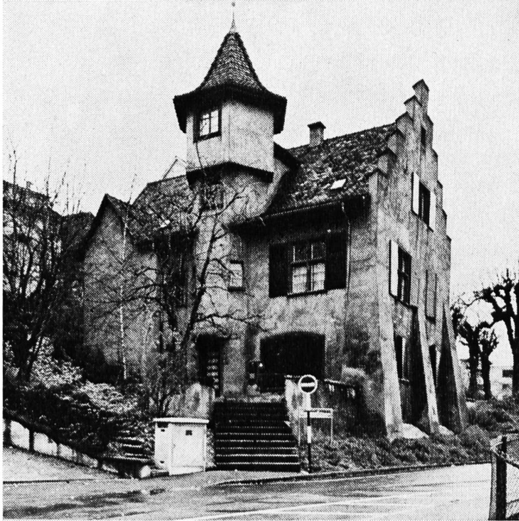
Das Holeeschloss vor der Restaurierung.

eines der Gundeldinger-Schlösser. Er lebte auf grossem Fuss, ging aber fromm zur Kirche, ja stellte sich gar einem der Kinder des ersten reformierten, über 73jährigen Pfarrers zu St. Leonhard als Pate. Erst drei Jahre nach seinem Tod, als die Erben 1559 untereinander Streit bekamen, wurde ruchbar, wen die Basler eigentlich aufgenommen hatten: Einen wohl sehr hochstaplerischen Sektenführer, der sich von seinen Anhängern als Prophet verehren liess und die gespendeten Gemeindegelder offenbar für seinen eleganten Lebensstil verwendete — dabei war er von Beruf ein einfacher, aber modisch schillernder Kunstmaler! So wurde David Joris nachträglich noch zum Feuertod verurteilt; seine Leiche wurde ausgegraben und vom Henker vor den Stadtmauern verbrannt — sehr zum Gespött der Andersgläubigen. Mit den Nachkommen waren die Basler Ratsherren indessen nachsichtig und zogen sie keineswegs «bis aufs Hemd» aus.