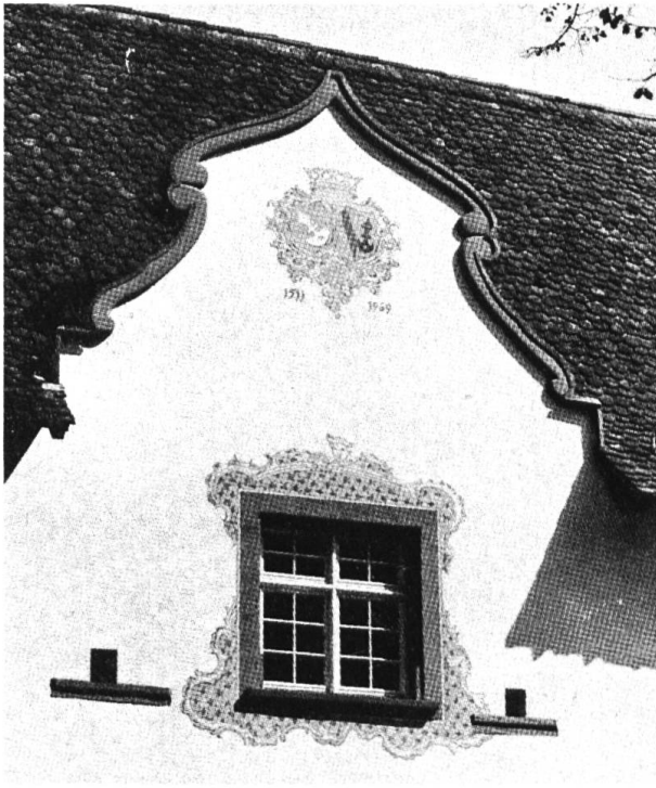
Der barocke Schweifgiebel über dem Eingangstor mit Reichenstein- und Inzlingergemeindewappen. Neben dem Fenster die Führungsschlitze für die Kette der Zugbrücke.