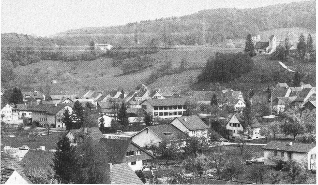
Ziefen 1979. Blick vom Bockmätteli gegen die Kirche. In der Mitte das neue Mehrzweckgebäude.