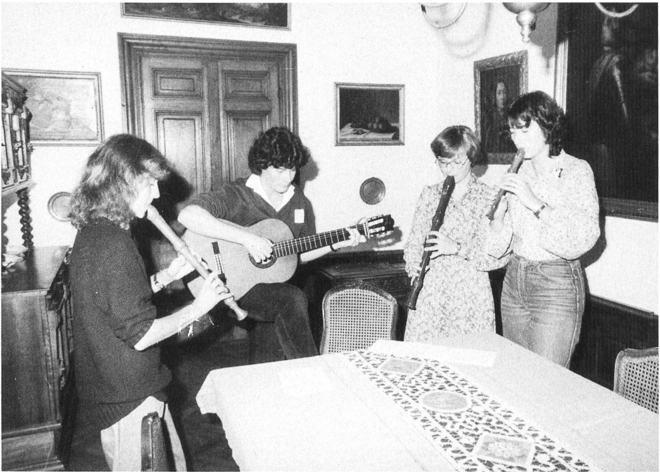
Seminaristinnen spielen für Sehbehinderte auf Waldegg im Frühstückszimmer.