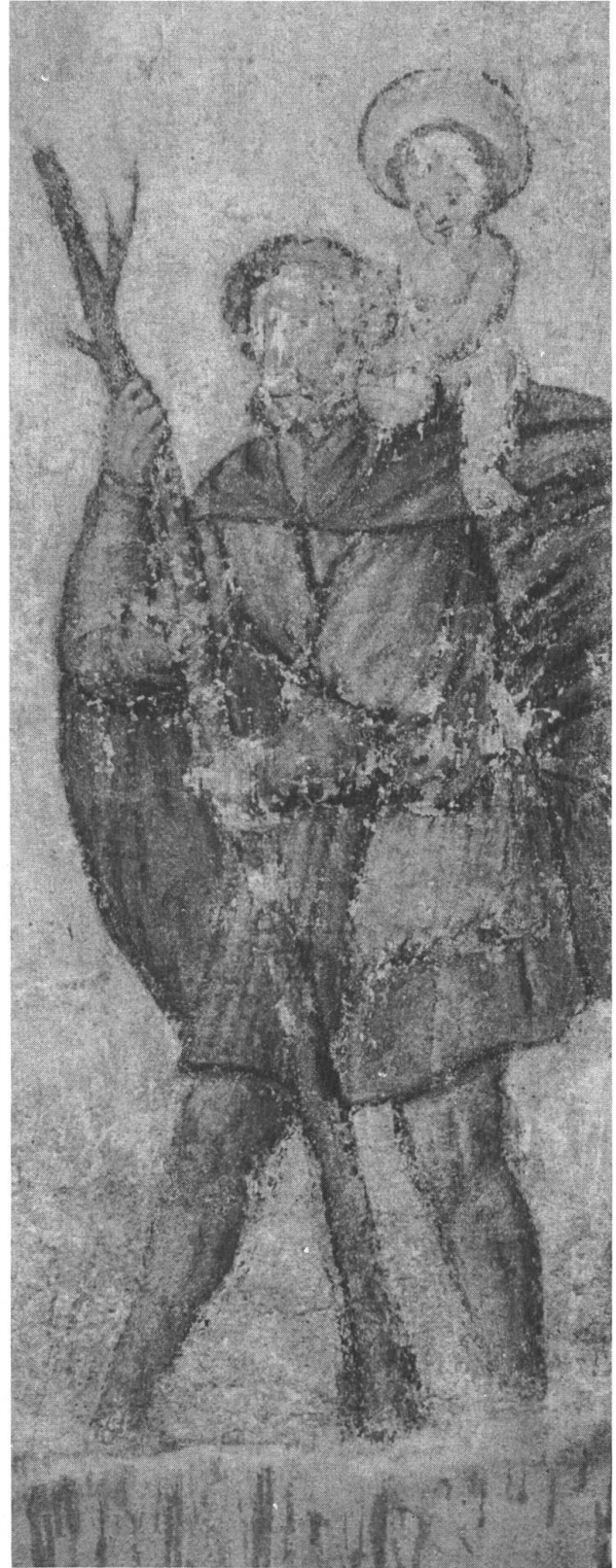
Imbergässlein 31: Fassadenbild Christophorus, gegen 1500.