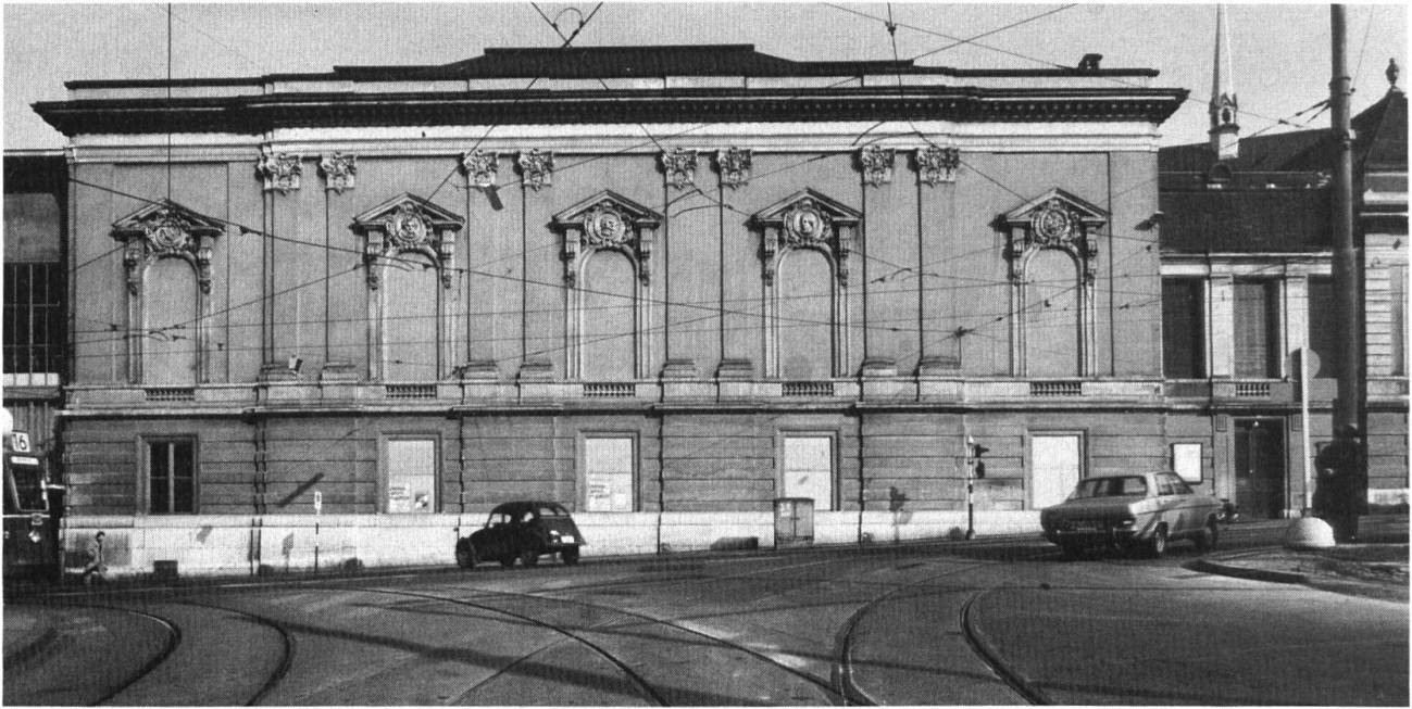
Steinberg 14: Musiksaal ohne und mit Fensterimitation in den blinden Öffnungen.