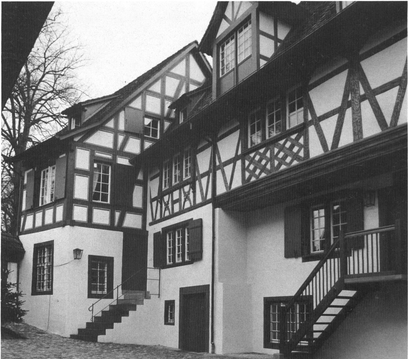
St. Alban-Tal 44/46: Schindelhof, Riegelwerk des 16. und des 17. Jahrhunderts im Hof.

werk als geschlossene Einheit gegen den Hof abgelesen werden kann und für Basel des Alters und des ungestrichenen Holzes wegen eine Seltenheit darstellt. Im St. Alban-Tal sind gleich weitere Objekte zu nennen: Die beiden Museen sind gebührend gefeiert worden, das eine, das Museum für moderne Kunst als geglückter Neubau in alter Umgebung, die Gallician-Mühle als Papiermuseum in der ehemaligen Papiermühle, eine von der Nutzung her sinnvoll erneuerte Einheit eines — es sei die Formulierung erlaubt — musealen lebendigen Denkmals. An der Stadtmauer wurde von Maurer und Zimmermann ausgezeichnete handwerkliche Arbeit geleistet. Hier konnte der alte Zustand gesichert, Putz erhalten und nach diesen Zeugen teilweise erneuert und auf Grund der baugeschichtlichen Untersuchung jedes