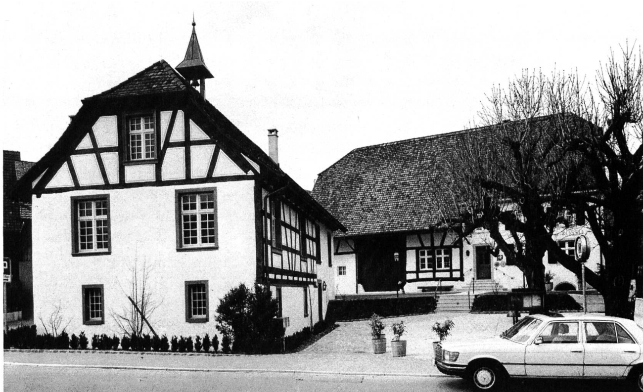
Ehemaliges Spritzenhaus und Gasthaus zum Rössli in Oberwil, beide aus dem 19. Jahrhundert und von der Bürgergemeinde restauriert.

Feiern zum 300-Jahr-Jubiläum des Domes ging die Restaurierung der Domplatzfassaden der Domherrenhäuser 5 und 7, heute Gerichtsgebäude, zu Ende. Ersetzt wurden dabei die Eingangstrepfen, während man die Sonnenuhr in den ursprünglichen Farben wieder herstellte. Der Kredit für die Gesamtrestaurierung der beiden Gebäude wurde vom Landrat nach einer ersten Zurückweisung bewilligt. Gegen Ende des Jahres konnte die alte, nunmehr vollständig restaurierte Trotte der Öffentlichkeit übergeben werden. Nachdem sie lange Zeit den Wegmachern gedient hatte, soll sie nun zur Aktivierung des Dorflebens beitragen. Dank der Unterkellerung gewann man im Erdgeschoss einen grossen Raum für Ausstellungen, Konzerte oder gesellige Anlässe. Das Dachgeschoss wird die Sammlungen des Heimatmuseums