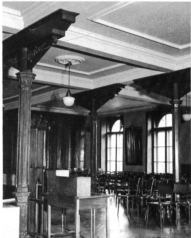
Speisesaal im 1871 erbauten Kurhaus in Langenbruck mit gusseisernen Stützen und Gipsdecken.

In Liestal fand die Restaurierung des alten Zeughauses in der Altstadt ihren Abschluss, indem es gegen Ende Jahr seiner zukünftigen Zweckbestimmung als Kan-