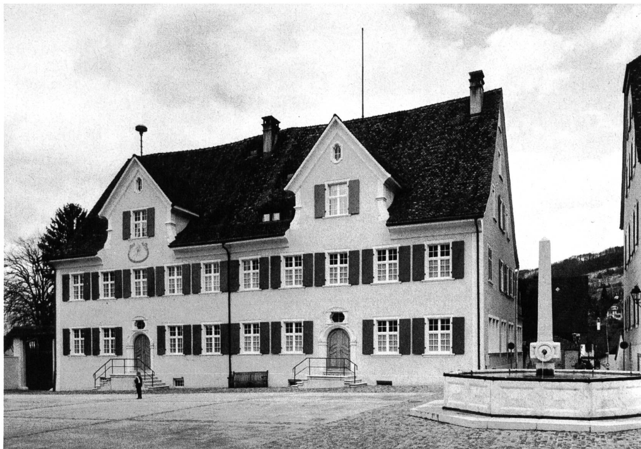
Ehemalige Domherrenhäuser in Arlesheim, heute Gerichtsgebäude, nach der Restaurierung der Domplatzfassaden.

der Entscheidung, das Innere in den Zustand des 17. Jahrhunderts zurückzuführen, richtig war. Jedenfalls passen die Holzdecken und Dekorationsmalereien gut zueinander.