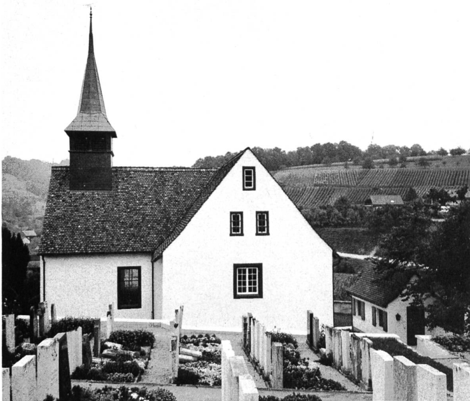
Das Äussere der 1676 erbauten Reformierten Kirche von Wintersingen mit den zwei im rechten Winkel aufeinanderstossenden Schiffen.

matschutz, die Zonenreglements-Normen, das Baugesetz und das Reglement über Reklamen und Signale. Das rechtliche Hauptinstrument ist zweifellos die Heimatschutzverordnung von 1964, da diese allumfassend ist und alles verhindern kann, was nach objektiven Gesichtspunkten eine erhebliche Beeinträchtigung oder Störung des Orts- oder Landschaftsbildes verursachen könnte. Gleichzeitig ist sie auch das Instrument für die Unterschutzstellungen von Bau- und Naturdenkmälern und für die Subventionen. Erstaunlicherweise kann aufgrund dieser Verordnung jedermann Einsprache erheben, d. h. auch private Organisationen oder Einzelpersonen können aus dem Gesichtspunkte des Heimatschutzes gegen ein Projekt Einsprache erheben. Tatsache ist jedoch, dass von diesem Recht selten oder nie Gebrauch gemacht wird. So haben sogar der Baselbieter Heimatschutz oder der Naturschutzbund Baselland noch nie aufgrund dieser Verordnung Einsprache erhoben. Daraus wird ersichtlich, dass die Hauptlast der Aufgaben im Bereich der Denkmalpflege und des Natur- und Heimatschutzes bei den staatlichen Organen liegt.