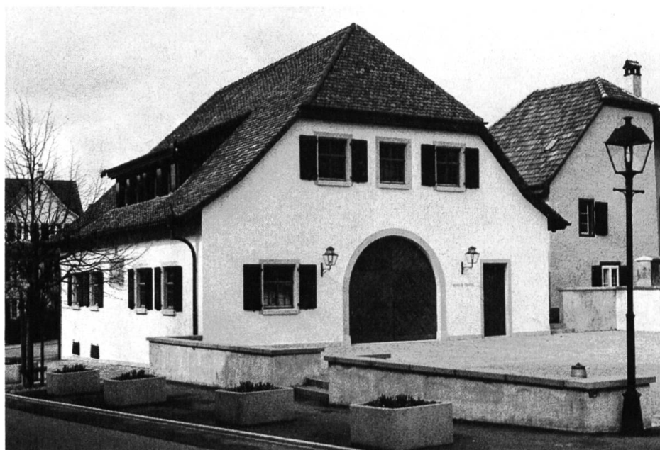
Ehemalige Trotte in Arlesheim nach der Restaurierung mit dem neuen Dorfplatz davor.

In Tenniken restaurierte man das Äussere des Pfarrhauses. Die dabei zum Vorschein gekommenen Baufugen stimmen mit der von Karl Gauss verfassten Baugeschichte über dieses Pfarrhaus überein. — In Wintersingen konnte die restaurierte Kirche eingeweiht werden. Die aus dem 17. Jahrhundert stammende Winkelhakenkirche mit den beiden im rechten Winkel aufeinander stossenden Schiffen war zu Beginn des 20. Jahrhunderts mit Gipsdecken und Gipsbrüstungen versehen worden. Es zeigte sich, dass