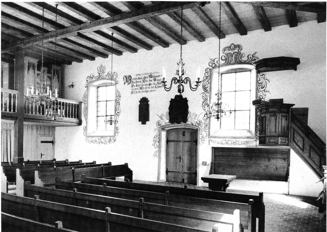
Inneres der Winkelhakenkirche von Wintersingen mit Kanzel, Epitaphien, alter Holzdecke und Empore mit neuer Orgel.

— Ein Fachwerkhaus in Schönenbuch , das zum Teil mehrteilige gotische Fenster besitzt. — Das Gasthaus Rössli und das Spritzenhaus in Oberwil , beide aus dem Anfang des 19. Jahrhunderts und zugleich eine Gebäudegruppe im Dorfzentrum, die von der Bürgergemeinde erworben und restauriert worden ist. — Die beiden ehemaligen Bauernhäuser Burggasse 7 und 16 in Muttenz , die zu Wohnzwecken umgebaut und restauriert worden sind. — in Pratteln ein Kleinbauernhaus an der Liestalerstrasse Nr. 7. — Das Bad Bubendorf bei Bubendorf aus dem 18./19. Jahrhundert mit dem Hauptgebäude und dem ehemaligen Pächterhaus, heute Badhüsli genannt.