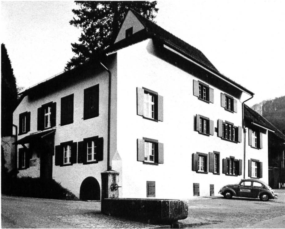
Das Pfarrhaus von Tenniken mit dem dreigeschossigen Kernbau von 1559, dem Pultdachanbau aus dem 17. und dem zweigeschossigen Südteil aus dem 19. Jahrhundert.

Alle Unterschutzstellungen erfolgten auf freiwilliger Basis mit Zustimmung der Eigentümer. Vom Abbruch bedroht war einzig ein Bauernhaus am Friedhofweg 7 in Füllinsdorf. Seine Substanz konnte durch die Gemeinde aufgrund eines mit dem Eigentümer ausgehandelten Vertrages gesichert werden, doch fehlt noch der Wille des Eigentümers zur Sanierung. Mit bereits zwei Gutachten wollte er nachweisen, dass das Haus nicht mehr erhalten werden kann. — Nicht unbedingt als Verlust ist der Abbruch des 1871 erbauten Kurhauses in Langenbruck zu bezeichnen, war doch dieses Gebäude trotz seiner markanten Stellung am Dorfeingang architektonisch nicht besonders wertvoll. Die vier im Foyer in die Wände eingelassenen Rundbilder in Öl auf Leinwand, gemalt von dem damals bekannten Kunstmaler Arnold Jenny, mit Landschaftsdarstellungen konnten erworben und abgenommen werden.