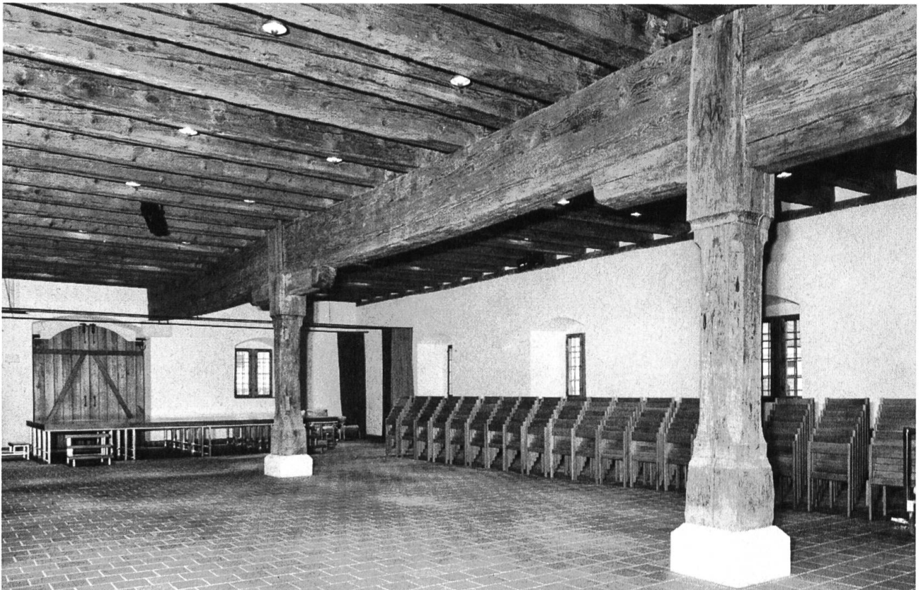
Erdgeschoss des ehemaligen Zeughauses in Liestal, heute Kantonsmuseum mit mächtigen Balken und Holzstützen.

zu genügen, präsentiert es sich aussen zusammen mit dem ehemaligen Pächterhaus wieder wie früher. Jedenfalls hat es sich gelohnt, dass die Heimatschutzkommission an der Erhaltung des Pächterhauses, das sehr baufällig war, festhielt. Eine Tafel neben dem Eingang erinnert daran, dass hier die ersten Versammlungen zur Gründung des Kantons Basel-Landschaft stattfanden. Nicht umsonst wird das Bad Bubendorf im Zusammenhang mit der 150-Jahrfeier des Kantons als Baselbieter Rütli bezeichnet. Vor wenigen Jahren war es im Besitze der Kantonalbank, die daran kein Interesse mehr zeigte und es dem Kanton anbot. Als dieser das Angebot ausschlug, ging es an