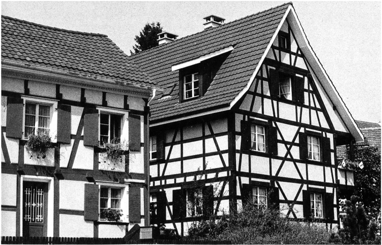
Fachwerkhäuser in Allschwil. Links ein älteres und rechts ein neuerbautes Fachwerkhaus.

tonsmuseum übergeben werden konnte. Noch fehlt allerdings der Ausbau des Innern als Museum. Die Restaurierung des aus dem 16. Jahrhundert stammenden und bei der Kantonstrennung um 1832/33 umgebauten Gebäudes stiess nicht auf grosse Probleme, doch erhitzten sich die Gemüter wegen der Farbgebung, dem weissen Verputz, den roten Kreuzstöcken und den grauen Läden. Kritik erweckte vor allem das Anstreichen der bei der Restaurierung sichtbar gemachten Ecksteine. Es zeigte sich, dass es klüger gewesen wäre, wie bei anderen Bauten dieser Zeit die Ecksteine verputzt zu lassen. Im Innern erhielt man ausserordentlich schöne und grosse Räume mit Holzdecken. Einzig im zweiten Obergeschoss findet sich ein Raum mit Holzboden und Gipsdecke, wie sie beim Umbau von 1833 entstanden. Anlässlich der Einweihung fand in den oberen Geschossen eine Ausstellung des Kunstkredits statt, die zeigte, dass sich die grossen Räume für Ausstellungen jeglicher Art vorzüglich eignen. Das aus dem 16. Jahrhun-