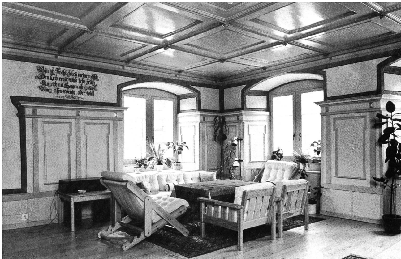
Stube im Obergeschoss des 1671 erbauten Neuhauses in Hölstein mit Holztäfer und -decke sowie Wandspruch aus der Erbauungszeit.

einen Privatmann, der sich der Geschichte und der Bedeutung des Gebäudes bei der Entstehung des Kantons voll bewusst ist.