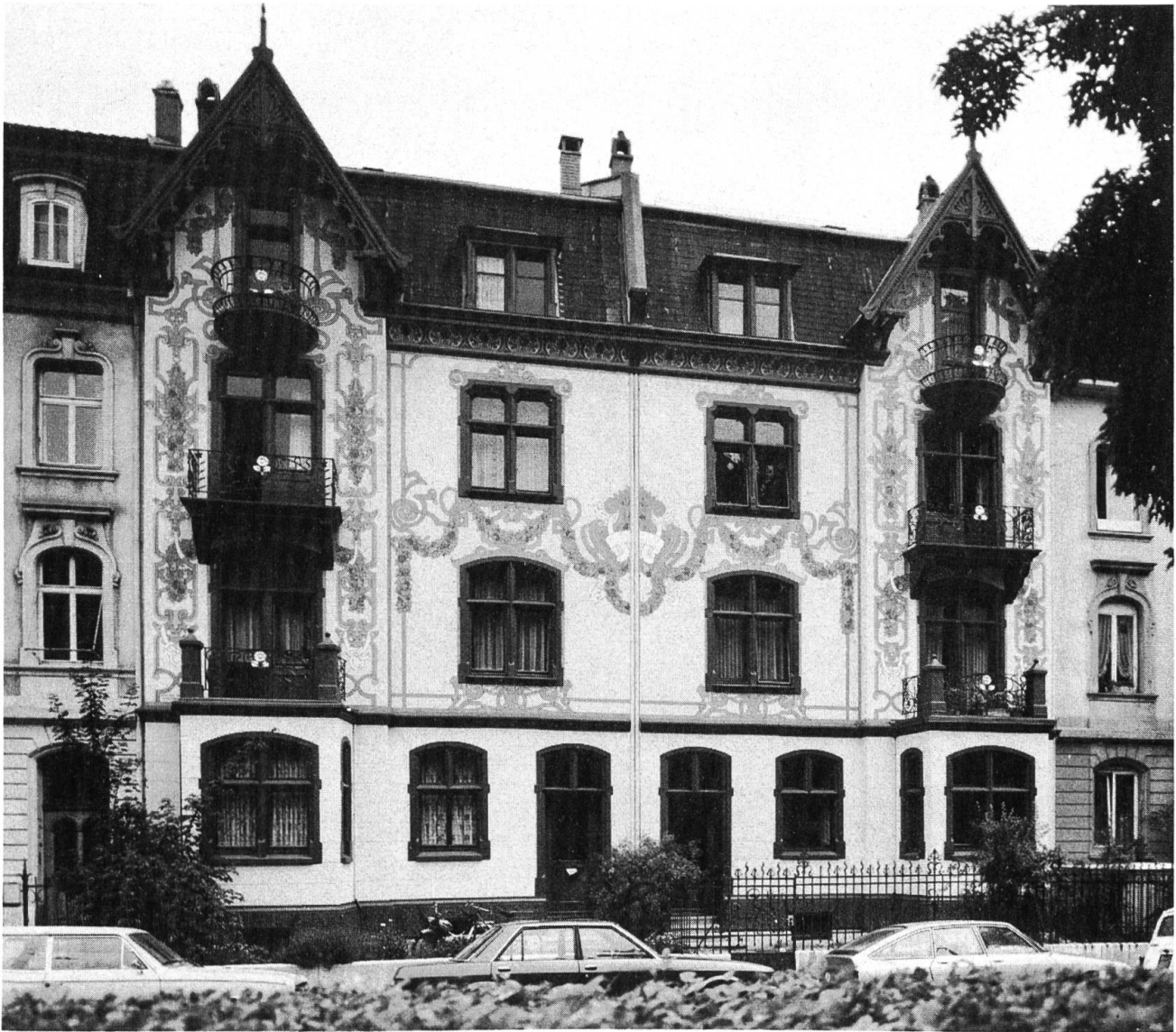
Gundeldingerstrasse 89 und 91. Architekt A. Kiefer. Jugendstildekoration von 1901 von Louis Dischler.

von weniger spektakulären Häusern mit Sorgfalt einrichtet, kann ich unter anderem für Häuser an der St. Alban-Vorstadt und am Petersplatz bezeugen. Wo man sich den Gegebenheiten des Baues fügt, bleibt viel von der alten Substanz und von echter Ambiance bestehen.