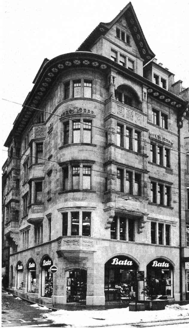
Hutgasse 2. Von Architekt Wilhelm Lodewig, 1913. Wiederhergestelltes Erdgeschoss am Marktplatz.

Wiederherstellung des Eckstückes Hutgasse 2 (W. Lodewig, 1913) mitsamt den Erkerkonsolen und den Steinreliefs. Hier hat die Öffentlichkeit den Eigentümern vieles zu danken.