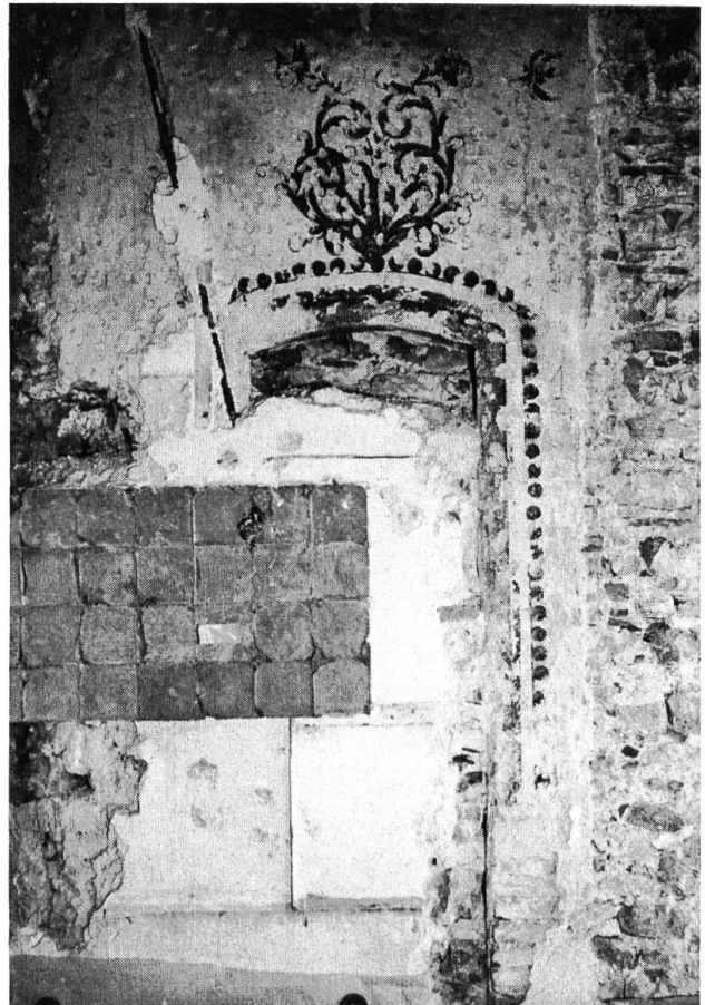
Nadelberg 17. Dekoration über einer Türe im ersten Geschoss, 16. Jahrhundert.