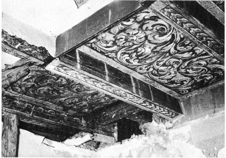
Nadelberg 17. Bemalte Balkendecke im 2. Geschoss in Fundsituation, um 1700.

Bemalte Balkendecken aus der Umbauzeit um 1700, eine ehemalige Türe ins Nachbarhaus, die mit maskenbesetzten Ranken verziert war, ein Boden mit eingelegten Friesen sind u. a. damit gesichert worden — gesichert, weil bei den eingreifenden Methoden neuerer Renovierungsarbeiten diese Dinge in der Regel nicht beachtet und daher zugrunde gerichtet werden. Man wird es verstehen, dass wir dies immer wieder neu festhalten. Es sind keine Einzelfälle; die grossartigen Funde in der «Goldenen Rose» und in der «Eisenburg» an der Martinsgasse 18 werden wir nach deren Restaurierung beschreiben, auch jene figürlichen und dekorativen Wandbilder im Hohenfirstenhof (Rittergasse 19), die um die Zeit des Umbaus von 1583 entstanden sein mögen. Zu erwähnen sind aber im mindesten jene nicht sichtbar zu erhaltenden Fragmente einer Fugenmalerei mit Nachbildungen von Marmorinkrustationen im Haus Nadelberg 16 , wie sie in der späten romanischen Malerei an Sockeln und Fensterleibungen üblich sind; ferner der aussergewöhnliche Fund eines bemalten Brettes in einer Bodenkonstruktion der Stadthausgasse 20 , das die Halbfigur eines Mannes zeigt (2. Hälfte 16. Jahrhundert).