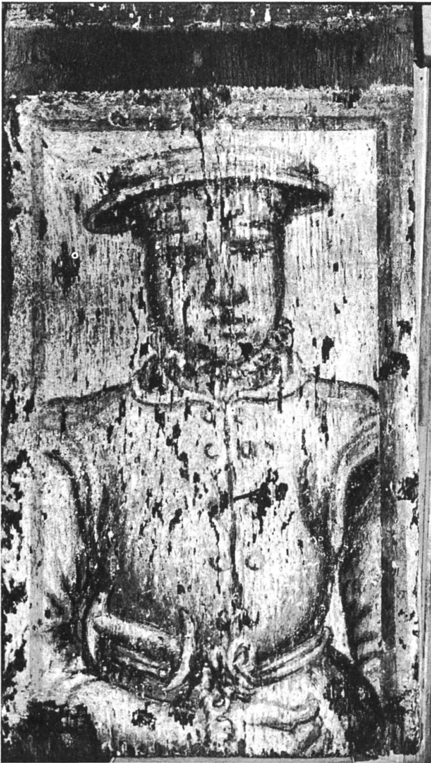
Bemaltes Brett, Spolie aus dem Haus Stadthausgasse 20.