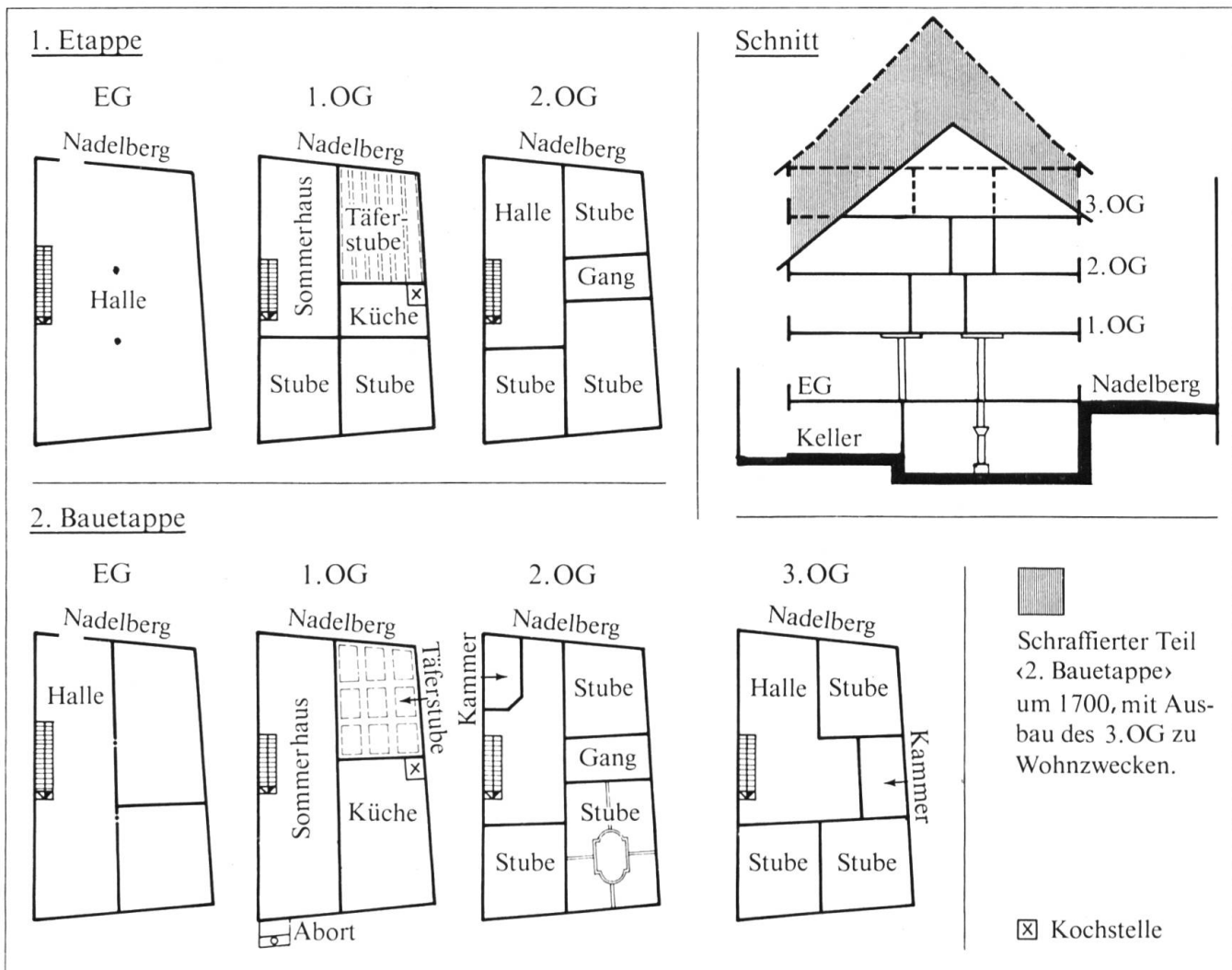
Nadelberg 17. Schematische Grundriss-Skizzen (und Schnitt): Zustand 16. Jahrhundert und barocker Umbau um 1700.

Die barocken Umbauten haben nebst der Aufstockung und der Unterteilung der Halle vor allem im ersten Obergeschoss Raumunterteilungen eliminiert und ein von Fassade zu Fassade durchgehendes Sommerhaus und eine grössere Küche gebracht. Die steile Blocktreppe blieb erhalten.