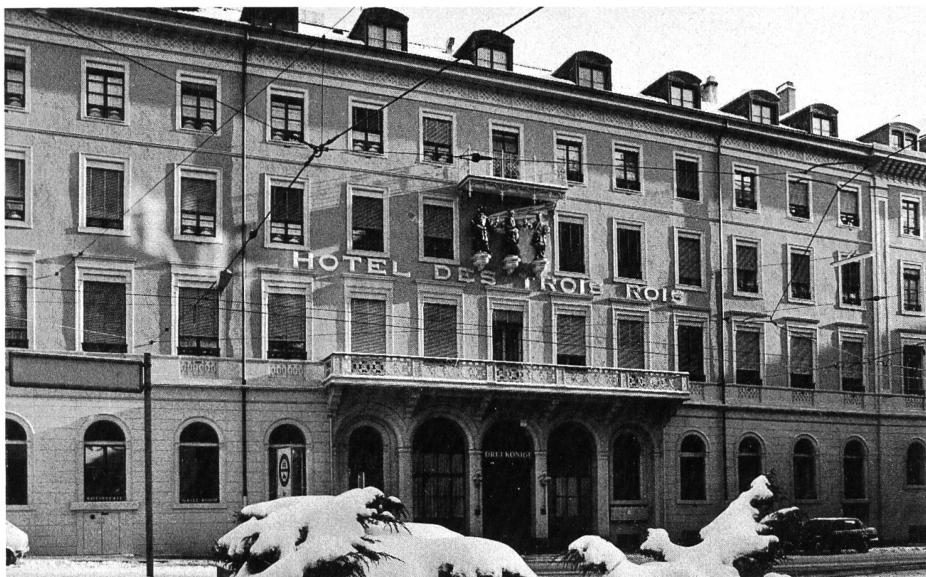
Hotel Drei Könige. 1844 von Architekt Amadeus Merian.