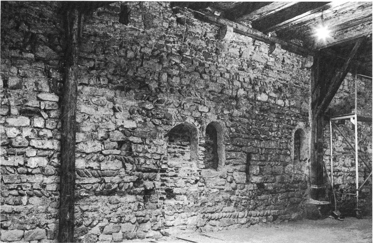
Schürhof, Münsterplatz 19. Ursprüngliches Scharfenfenster und später eingebrochene spätromanische Fenster.