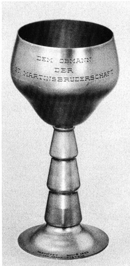
Der erste, 1943 von einem Gründermittglied gestiftete Obmannsbecher der St. Martinsbruderschaft.