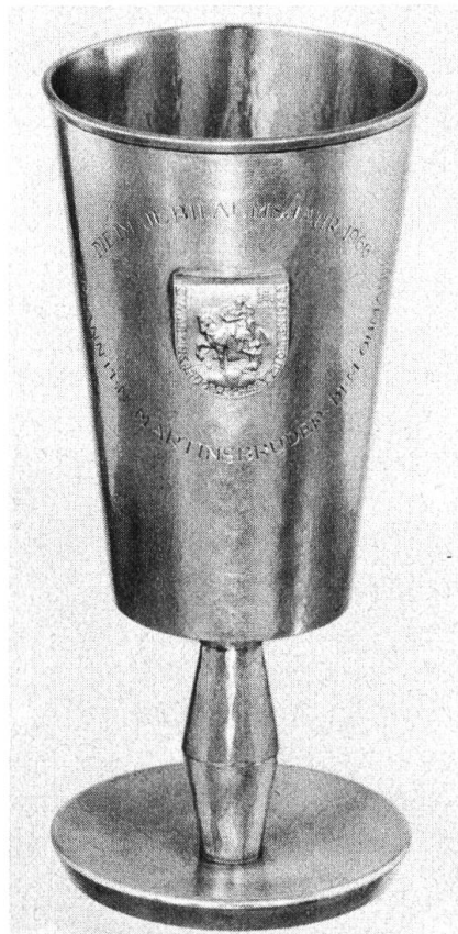
Der von den 1966 zu Martinsbrüdern ernannten Gesellen gestiftete zweite Obmannsbecher.

Jahre 1683. Diese Einträge, Pergamente und Bücher belegen ein zünftisches Leben in Olten, das sich für eine Kleinstadt durchaus sehen lassen darf. Es überrascht daher nicht, dass sich schliesslich wieder Männer fanden, die solche traditionelle Meisterschaften, wenn auch nicht einseitig bloss nach Berufsgruppen gebildet, aufleben zu lassen wünschten.»