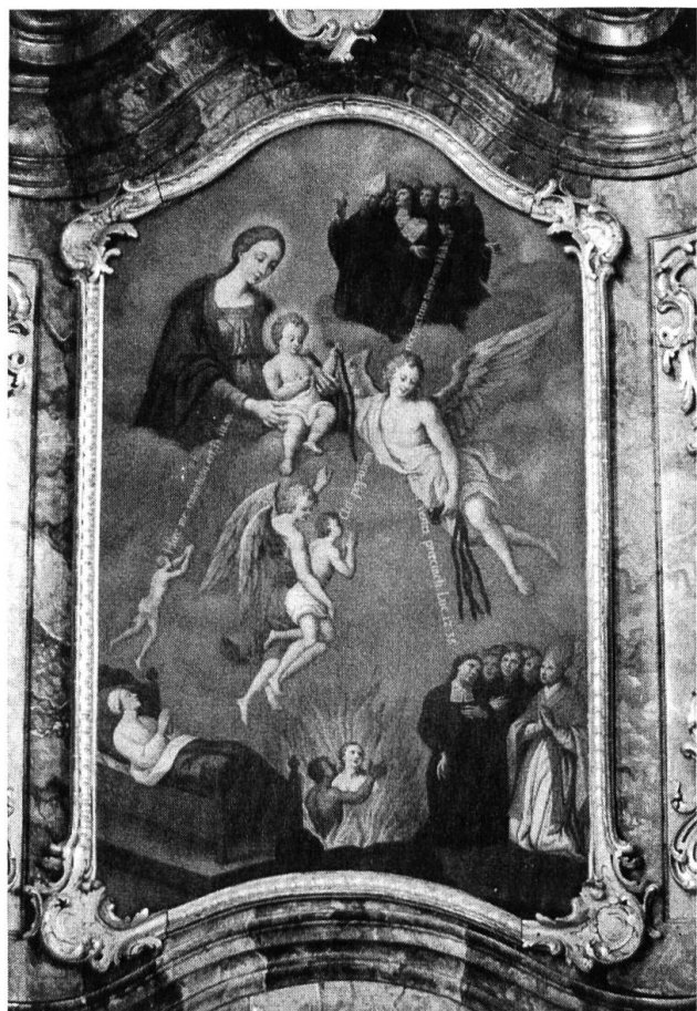
Maria als Trösterin der Sterbenden und der armen Seelen im Fegfeuer. Bruderschaftsbild auf dem linken Seitenaltar der Pfarrkirche Egerkingen.