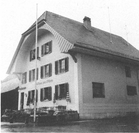
Gasthaus «Ochsen», Neuendorf.