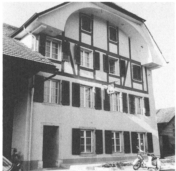
Gasthaus «Sonne», Niederbuchsiten, nach der Restaurierung.