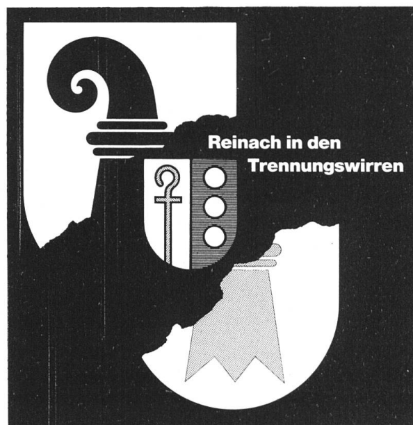
Titelbild einer Broschüre, erschienen 1983 als Ergänzung zur Wanderausstellung «Baselland unterwegs» 150 Jahre Kanton Basel-Landschaft.

Schon am 22. Februar entzog der Basler Grosse Rat jenen 46 Gemeinden, die nicht