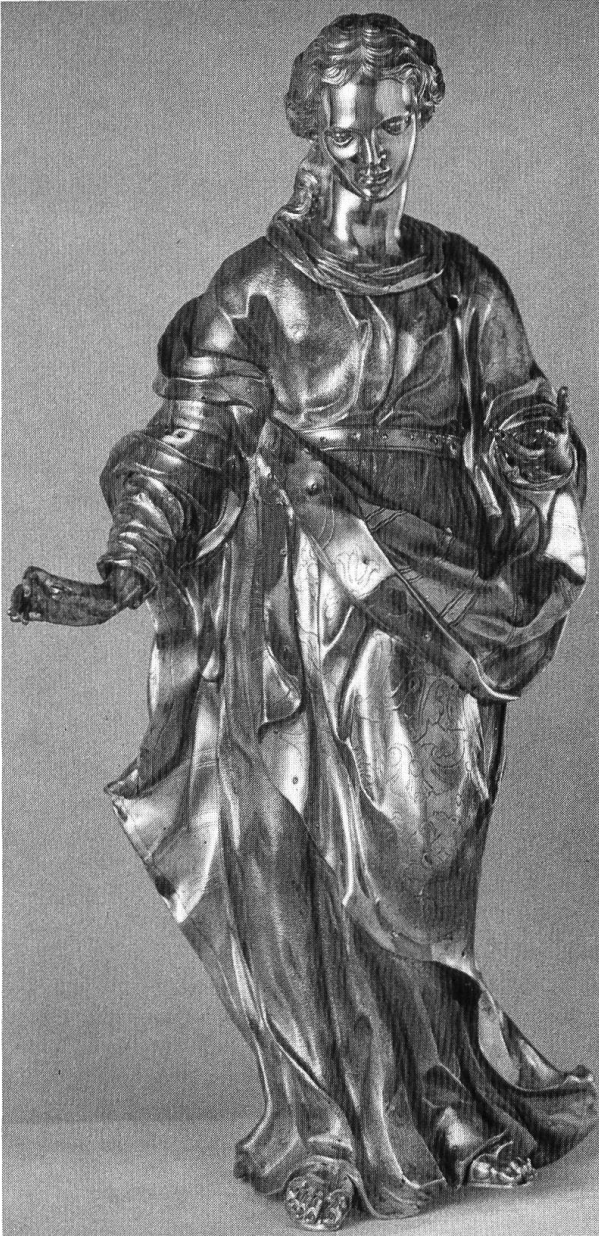
Marienfigur ohne Kind. Attribute und steinbesetzte Borten sind ebenfalls abgeschraubt.

ment aufgestellt. Die Figur misst knapp 70, das ganze Bildwerk 148,5 cm. Ein grosser Strahlenkranz aus vergoldetem Kupfer hinterfängt sie und schliesst die an der Rückseite üblicherweise offene Statue, die aus Kosten- und Gewichtsgründen — bei den Prozessionen musste sie ja getragen werden — nicht vollrund gearbeitet ist. Die Gottesmutter hält links den segnenden Christusknaben, ist als Himmelskönigin mit Szepter und Krone ausgestattet, während sie durch den Zwölf-Stern-Nimbus, die sich zu ihren Füssen windende Schlange (Apfel im Maul abhanden gekommen) und die Mondsichel