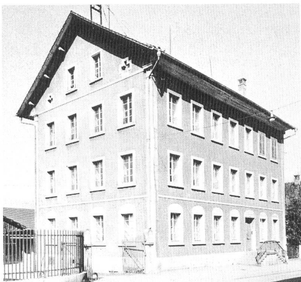
Ehemals Schuhfabrik Schenker, dann Berufsschulhaus an der von Rollstrasse.